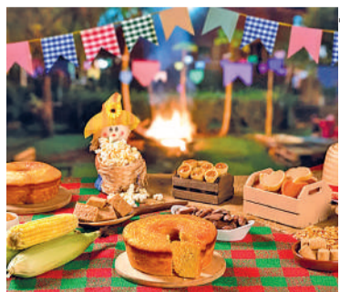
FESTA inicia às 14h no Progresso

Entre os destaques estão as atividades para o público infantil,