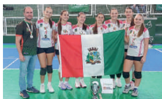
EQUIPE enfrentou Rio do Sul na decisão

A próxima fase da OLESC acontecerá entre os dias 26 e 30 de agosto, em Presidente