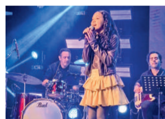
RAIANA segue para a semifinal

O “Santa Catarina Canta – Festival de Música Brasileira” é uma realização do Governo do Estado de Santa Catarina, por meio da Fundação Catarinense de Cultura (FCC), com produção geral da Camerata