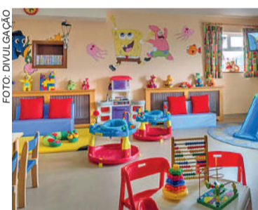
EDUCAÇÃO informou que adota medidas para ampliar vagas

A pasta ressaltou que o preenchimento das vagas segue critérios definidos pela Resolução Municipal nº 05/2025, que estabelece prioridades para atendimento, incluindo crianças com deficiência, situações de vulnerabilidade social, determinações judiciais, famílias monoparentais inscritas no CadÚnico, beneficiários de programas sociais, mães adolescentes e responsáveis com vínculo de trabalho.