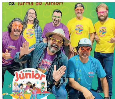
PROJETO oferece boas práticas à crianças

Entre os destaques está a produção musical voltada ao público infantil. Canções como "Girafa Amigona" e "Salada de Frutas" abordam temas como amizade,