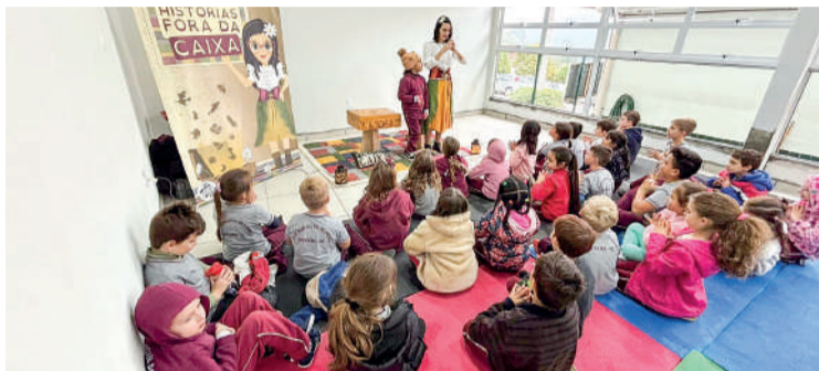
PROJETO é viabilizado com recursos do FIA em Ibirama

PROJETO LEVA leva teatro e literatura infantil para alunos do Ensino Fundamental