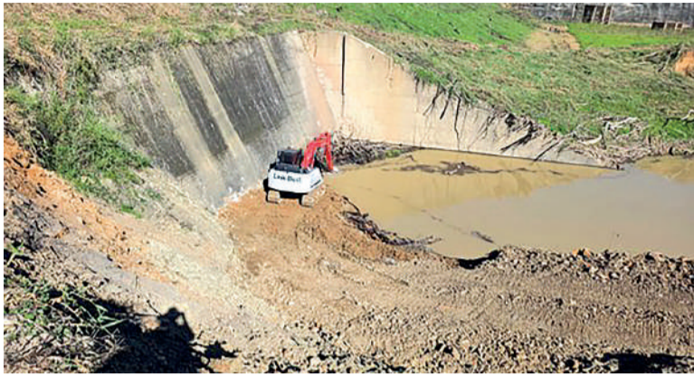
OBJETIVO é reduzir nível de água para acessar comporta

Nesta fase, os trabalhos estão concentrados na galeria de descarga da estrutura. Para permitir o acesso ao fundo da galeria, foi executado um ater-