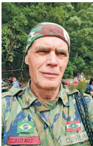
BIÓLOGO recebeu moção

Também ganharam destaque os trabalhos de monitoramento das espécies raras e endêmicas Dyckia ibiramensis e Dyckia brevifolia , além do acompanhamento da Raulinoa