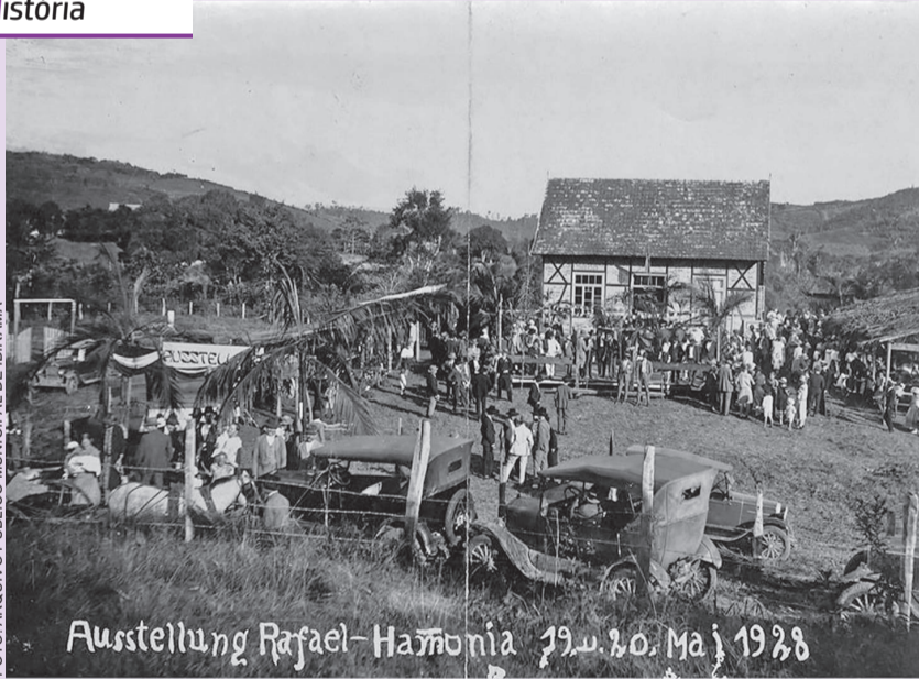
Ausstellung Rafael-Hamônia 19. u. 20. Mai 1928

EXPOSIÇÃO NO RIO RAFAEL EM HAMÔNIA. A foto foi datada como sendo de 20 de maio de 1928. Mais em Facebook/ Arquivo Público Municipal de Ibirama.