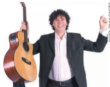
PALESTRA -show será na S. D. União