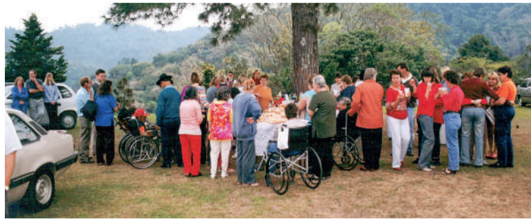
ENTRE AS AÇÕES do Grupo Repartir está o acompanhamento de pessoas com deficiência e suas famílias

Ao longo do ano, a entidade realiza doações de roupas, calçados, móveis, enxovais para bebês, kits de cozinha, alimentos e fraldas para pessoas acamadas. Também disponibiliza equipamentos de mobilidade, como cadeiras de rodas, andadores, muletas e cadeiras sanitárias, por meio de empréstimos e locações