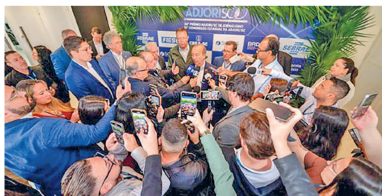
JORNAL Vale do Norte irá participar de evento