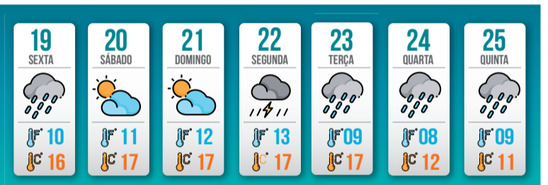
FOTO DA SEMANA