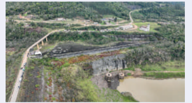
UMAS comportas apresenta danos

Além disso, a barragem está no centro de um processo histórico de reparação com as comunidades indígenas. A Terra Indígena Ibirama Laklãnõ, onde vivem os povos Xokleng, Guarani e Kaingang, foi diretamente impactada pela construção do reservatório