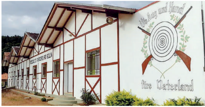
LANÇAMENTO acontece na Sociedade de Atiradores Rio Sellin

O documentário "As Realezas do Vale" retrata a tradição da busca de reis e rainhas dos clubes de tiro e do bolão, prática cultural trazida pelos primeiros colonizadores alemães e preservada até hoje em clubes e associações do Vale do Itajaí. A produção conta com direção-geral de Viviane Regina Calikevstz e direção de fotografia e edição de Ricardo Kugler, profissionais que atuam há mais de 15 anos na área