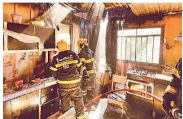
FORAM 87 registros do tipo no ano passado

“Historicamente, durante os meses mais frios, o número de ocorrências relacionadas a fon-