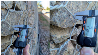
NA IMAGEM 1 (À ESQUERDA) tem-se a medição com paquímetro do diâmetro externo da malha. Na imagem 2 (à direita), após remover-se o revestimento de PVC pode-se aferir o diâmetro da alma de aço.

Ainda de acordo com a nota, assim que tomou conhecimento da irregularidade, o Município formalizou notificação ao Consórcio, que adotou as providências cabíveis junto às empresas fornecedoras. Como consequên-