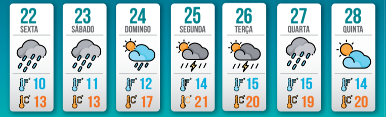
FOTO DA SEMANA