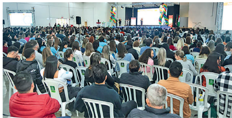
PROGRAMAÇÃO reuniu profissionais de educação, saúde e assistência social

A programação, iniciada às 7h, percorreu temas como estratégias pedagógicas para sala de aula, intervenção precoce, vínculo emocional, práticas inclusivas no neurodesenvolvimento, Plano Educacional Individualizado (PEI) e direitos jurídicos das pessoas autistas. O público reuniu profissionais da educação, saúde e assistência social, além de famílias atípicas do Alto Vale do Itajaí.