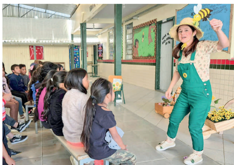
ALUNOS de escola indígena participaram da atividade

Idealizado pela contadora de histórias e agente cultural