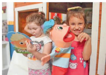
MUNICÍPIO arrecadou R$72mil no ano passado

Segundo o secretário, no ano passado o município arrecadou cerca de R$ 72 mil com a campanha, valor que possibilitou a contemplação de nove instituições e dez projetos voltados ao atendimento de crianças, adolescentes e idosos. “Se todas as pessoas que fizerem a declaração do im-