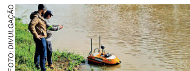
UDESC promoveu treinamentos

O ADCP é uma tecnologia utilizada internacionalmente para