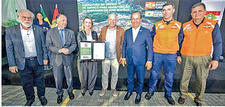
OBRA é uma das mais aguardadas para a segurança hídrica na região

OBRA DE QUASE R$ 10 MILHÕES vai modernizar a maior barragem de contenção de cheias do estado