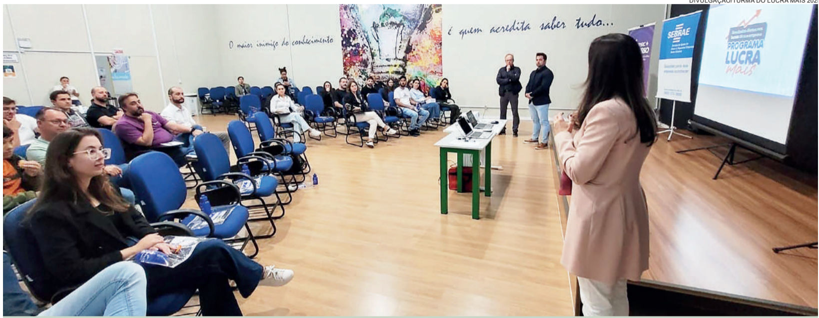
As vagas são limitadas e distribuídas por diversas regiões do estado.