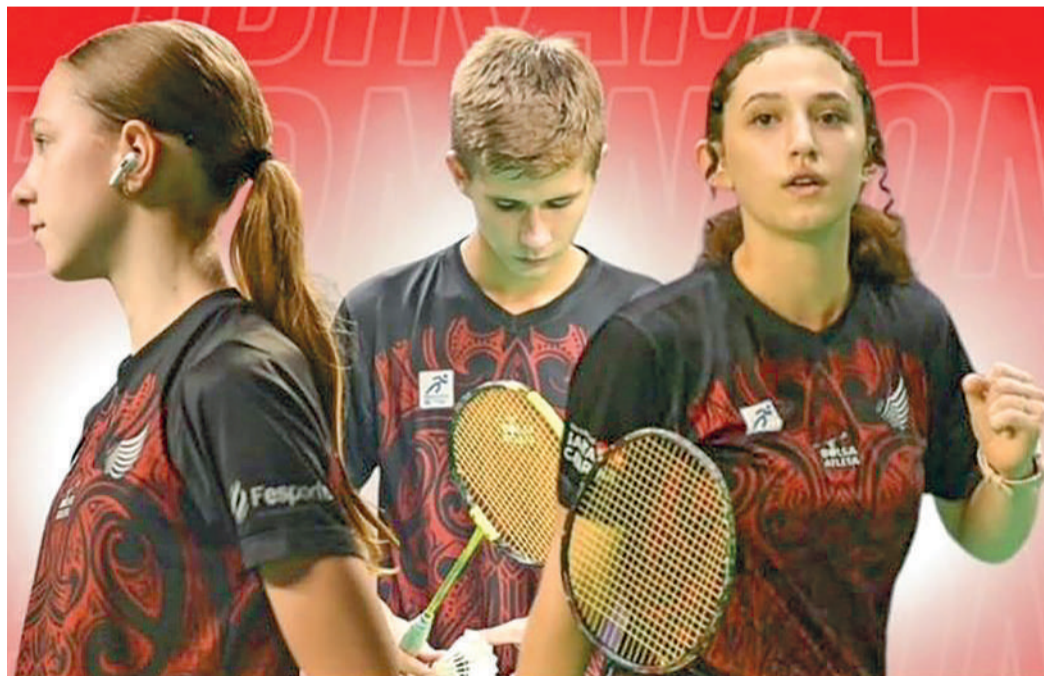
ATLETAS do Badminton ibiramense participam do Pan-Americano Jr

A competição será disputada em duas etapas. O torneio por equipes acontece entre os dias 17 e 19 de julho, enquanto as disputas individuais estão programadas para o período de 19 a 26 de julho.