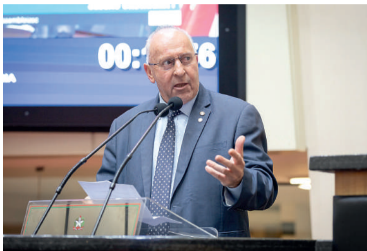
DEPUTADO manifestou preocupação com os projetos de duplicação

O deputado destacou que a BR-470 é fundamental para o escoamento da produção, deslocamento de