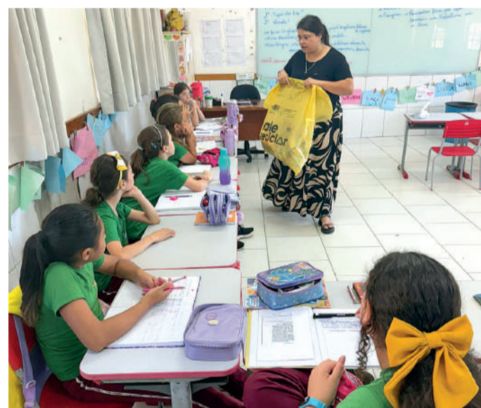
PALESTRAS educacionais são ministrada a alunos do município

A Diretoria de Meio Ambiente agradece à Secretaria de Educação pela parceria e apoio na realização dessas atividades, fundamentais para fortalecer a educação ambiental em Ibirama.