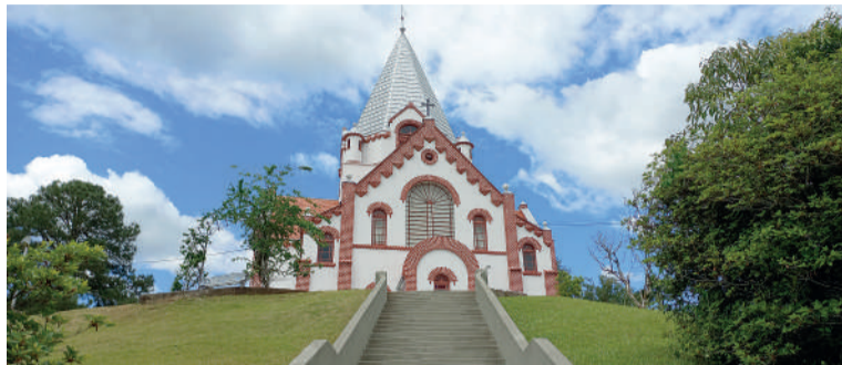
FUNDAÇÃO oficial da comunidade ocorreu em 1904

Ao meio-dia será servido o almoço festivo com buffet completo e churrasco. Durante a tarde, o público poderá acompanhar apresentações culturais do grupo folclórico Neu Bremen Volkstanzgruppe da banda Die Lustigen Musikantend, conhecida pelo repertório de músicas alemãs. O encerramento da festa