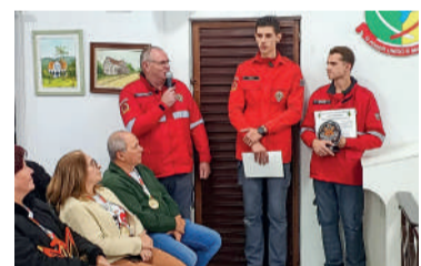
BOMBEIROS receberam moção