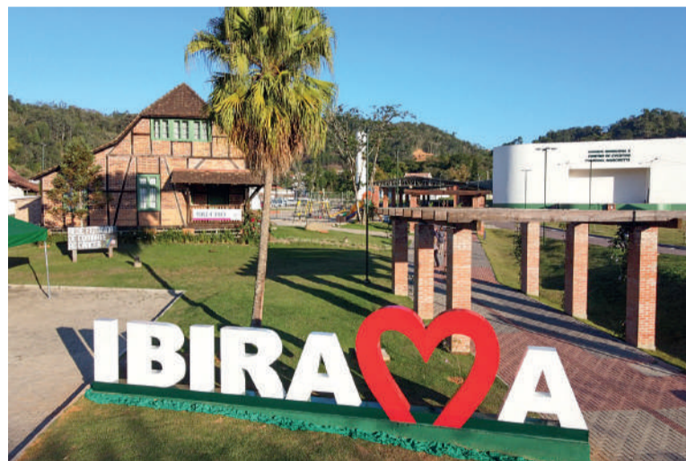
SEMINÁRIO acontece no Centro de Eventos Manoel Marchetti

Entre os temas abordados estarão diagnóstico e intervenção precoce, práticas inclusivas no ambiente escolar, desenvolvimento infantil, vínculo emocio-