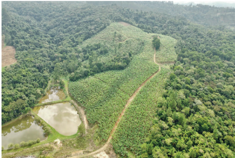
PLANTIO COMEÇOU em agosto de 2024 e ocupa atualmente uma área de aproximadamente seis hectares

De acordo com levantamento citado pelos envolvidos no projeto, o consumo de bananas apenas nos municípios do Vale Norte ultrapassa 40 toneladas por semana — volume que, atualmente, é majoritariamente suprido por produtos vindos de fora. O cenário abre espaço para produtores