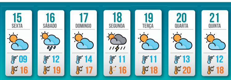
FOTO DA SEMANA