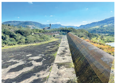
ASSINATURA ocorre na segunda-feira