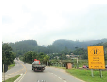
DNIT possui projetos

No Alto Vale, a exclusão preocupa principalmente por envolver diretamente a BR-470, considerada estratégica para a economia regional. O DNIT já possui projetos em andamento para duplicar