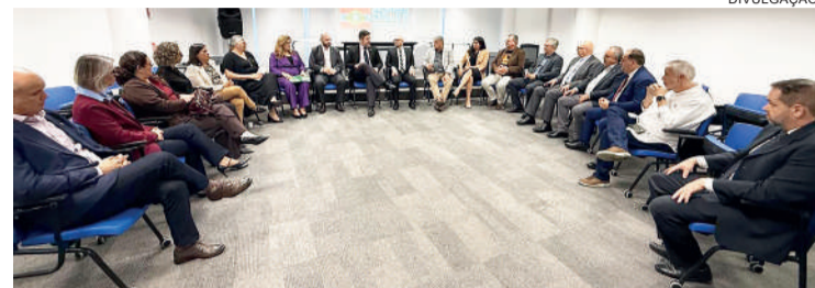
A iniciativa reforça o papel das universidades comunitárias no desenvolvimento catarinense e evidencia a consolidação de um ambiente de cooperação entre academia e poder público