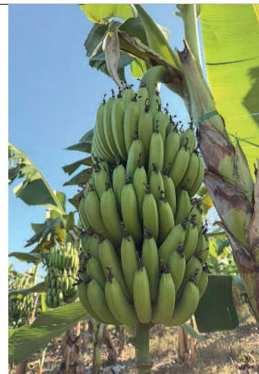
IMPLANTAÇÃO DA CULTURA representa um avanço importante na região

O plantio teve início em agosto de 2024 e ocupa uma área de seis hectares. Atualmente, a lavoura conta com três variedades: cerca de 500 pés de banana-da-terra (BRS Teranã), 3 mil pés de banana-prata (Prata Catarina) e 5 mil pés de banana caturra.