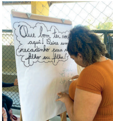
EVENTO reúne comunidade escolar

COMUNIDADE ESTÁ CONVIDADA para participar de caminhada, atrações infantis, entrega de boletins e atividades de integração