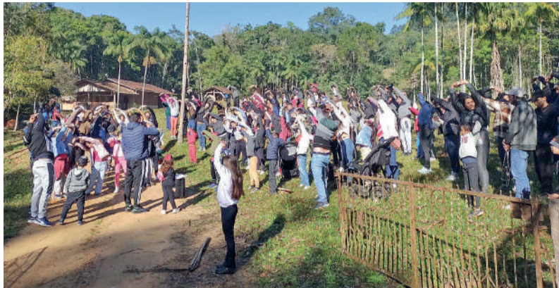
DIA DA FAMÍLIA na escola terá o wandertag da escola

Marcelo Zemke jornalvaledonorte@jornalvaledonorte.com.br