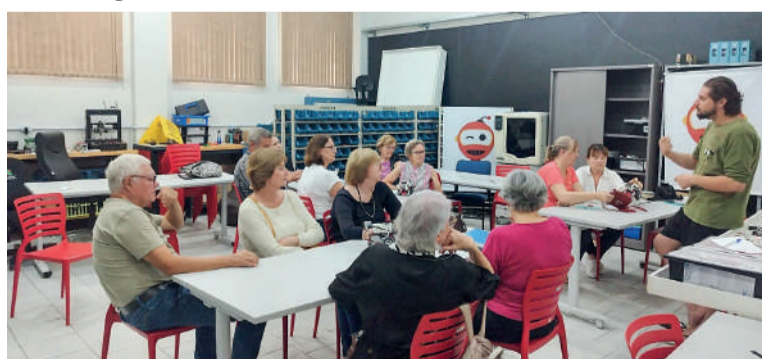
INICIATIVA reuniu participantes da terceira idade

Para muitos idosos, a atividade representou uma oportu-