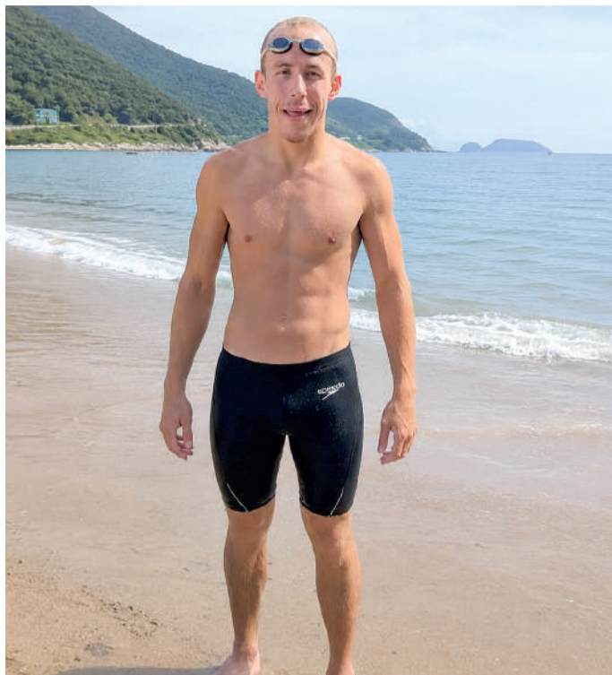
ATLETA de Ibirama integrou a equipe paralímpica

“Algumas águas nunca saem da memória. Elas apenas esperam o momento do retorno”, desta-