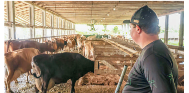
O programa tem como prioridade pequenos e médios produtores

O Banco Regional de Desenvolvimento do Extremo Sul (BRDE) movimentou R$ 83,8 milhões em março, primeiro mês de operação do Pronampe Leite BRDE/SC, iniciativa em parceria com o Governo de Santa Catarina para apoiar produtores do setor. No período, foram aprovadas 3.040 operações de crédito em 196 municípios catarinenses.