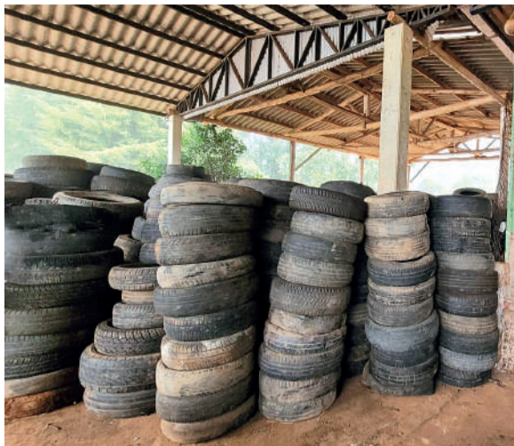
PEVs estão em funcionamento

cípio mantém pontos de entrega voluntária (PEVs) para o descarte contínuo de eletrônicos, pilhas, baterias e lâmpadas. Esses pontos estão instalados na Escola Valmor Ribeiro, no bairro Dalbérgia, na Escola Tancredo Neves, na localidade de Serra São Miguel, na unidade da Udesc e também no próprio Departamento de Meio Ambiente.