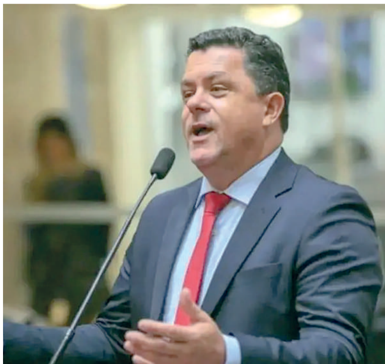
DEPUTADO destacou ações para Ibirama e região