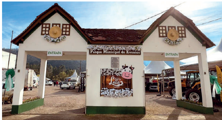
INSCRIÇÕES seguem até o dia 22 de maio e desfile ocorre no dia 30

Cada grupo deverá apresentar sua história e contribuição para o desenvolvimento de Presidente Getúlio, refor-