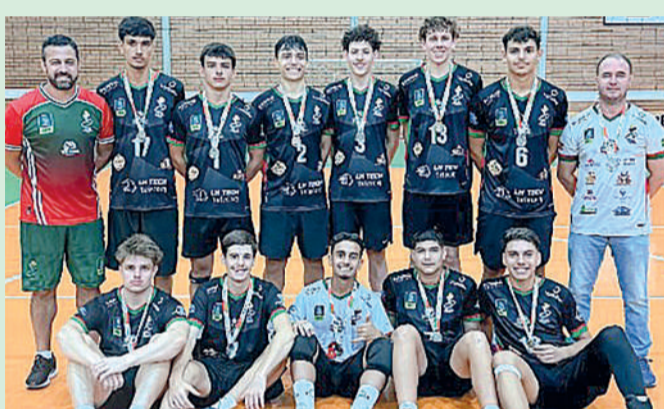
EQUIPE masculina de Vôlei enfrentou o Rio do Sul na decisão

voleibol, Ibirama garante presença na fase regional dos Joguinhos Abertos, que será disputada no mês de junho, reunindo as melhores equipes classificadas das etapas microrregionais.