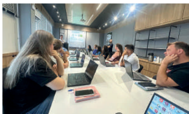
INICIATIVA busca fortalecer educação digital

cer a educação digital no município, alinhando as práticas pedagógicas às diretrizes da BNCC, que prevê o desenvolvimento do pensamento computacional, da cultura digital e do uso crítico das tecnologias desde a educação infantil.