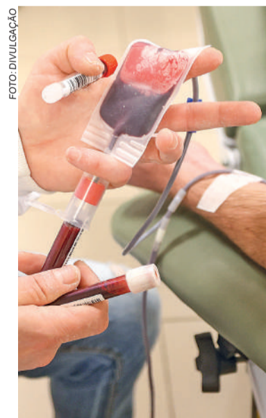
PREFEITURA disponibilizará transporte ao HEMOSC

A doação de sangue é um procedimento seguro, rápido e essencial para manter o funcionamento do sistema de saúde. A organização