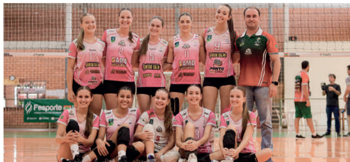
EQUIPE feminina de vôlei mostrou força diante dos favoritos

DESEMPENHO REAFIRMA O CRESCIMENTO DO ESPORTE IBIRAMENSE , especialmente nas categorias de base