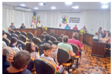
NÚMEROS foram apresentados na Câmara de Ibirama

O prefeito também destacou que as mudanças na saúde fazem