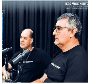
CONTRIBUINTES devem ter atenção com declaração pré-preenchida

Um dos aspectos mais relevantes da declaração é a possi-