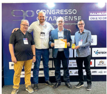
PREMIAÇÃO ocorreu durante congresso de cidades digitais