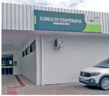
EXPECTATIVA é zerar fila em 15 dias

Mesmo com avanço na produção, o déficit persistiu. Em 2024, foram realizados 2.296 atendimentos. Já em 2025, esse número saltou para 3.311, um aumento de 44%. Ainda assim, insuficiente para conter a fila. “Hoje eu falo com propriedade e