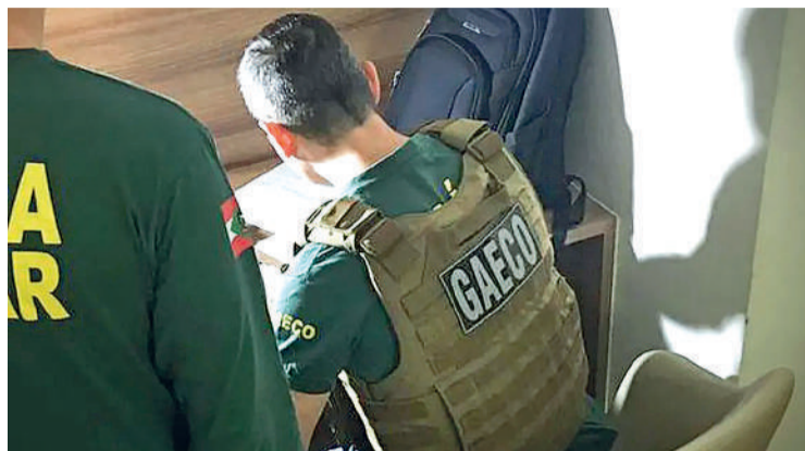
UM EX-AGENTE público e outras seis pessoas foram condenadas

O recurso apresentado ao Tribunal de Justiça de Santa Catarina sustenta que a sentença deixou de considerar elementos relevantes no cálculo das penas. Entre os principais pontos estão: Não aplicação de agravantes