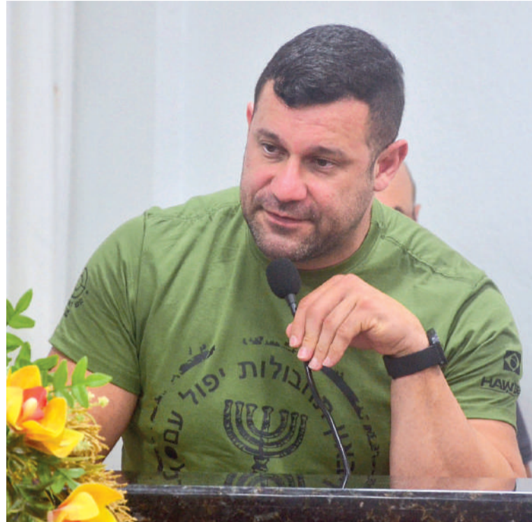
PARA vereador, é preciso “dar ferramentas adequadas às forças de segurança”

a entrega de um caminhão ao Corpo de Bombeiros Voluntários do município, com investimento de R$ 850 mil. O veículo será adaptado para operações com escada e combate a incêndios em altura.