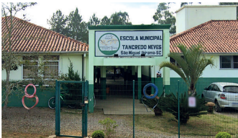
ESCOLA completa 51 anos

moração será o “túnel do tempo”, com exposição de fotos antigas e registros que mostram a evolução da escola ao longo das décadas. O material foi reunido com a colaboração de ex-funcionários, famílias e arquivos públicos, revelando momentos marcantes principalmente a partir dos anos 1980.