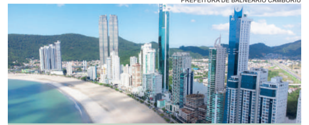
Balneário Camboriú registra crescimento expressivo na utilização de gás natural

A SCGÁS está realizando, em 2026, um importante conjunto de obras de ampliação de sua rede de gás canalizado em Balneário Camboriú.