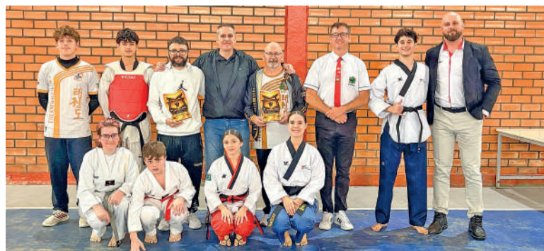
EQUIPE reforçou o quadro de medalhas

O evento reuniu equipes vinculadas ao instituto, que atua na formação de atletas e no desenvolvimento da modalidade em Santa Catarina, participando também de competições regionais e nacionais.