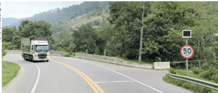
SERÃO cinco radares em Ibirama

De acordo com o DNIT, a ativação dos radares será feita de forma gradual entre a primeira e a segunda quinzena de abril, conforme a conclusão das etapas de instalação, sinalização e aferição. O processo completo deve levar até 12 meses.