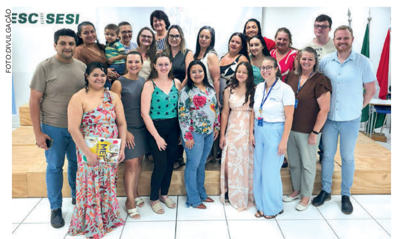
CURSOS formou turma de panificação e confeitaria

A ação da Administração Municipal tem como objetivo investir na capacitação da população, promovendo desenvolvimento econômico, inclusão social e valorização dos profissionais locais.