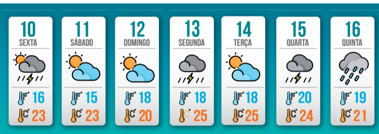
FOTO DA SEMANA