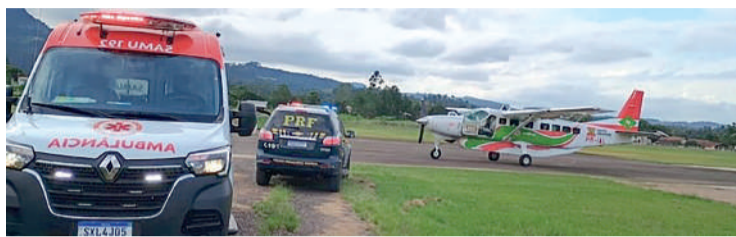
MOBILIZAÇÃO de equipes chamou a atenção da comunidade

A operação exigiu rapidez e precisão. A equipe deslocou-se até o Aeroporto de