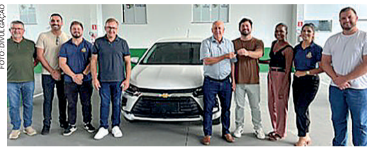
VEÍCULO foi adquirido por meio de emenda parlamentar