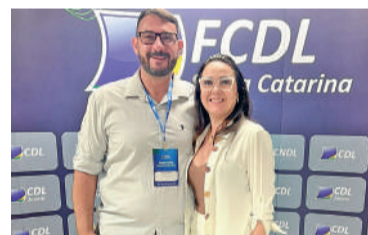
FUTURO do varejo esteve entre os temas da FCDL

Além da prestação de contas, foram debatidos temas estratégicos voltados ao futuro do varejo catarinense, com destaque para ações de fortalecimento do associativismo, ampliação de serviços aos lojistas e investimentos em inovação e tecnologia. A atuação institucional da Federação junto ao poder público também ganhou evidência, especialmente em pautas como simplificação