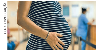
MULHER deverá ser indenizada

A perícia judicial foi categórica ao apontar falhas no atendimento, destacando a ausência de investigação obstétrica apropriada e a falta de encaminhamento para unidade de referência. Para