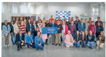
PROJETO fortalece iniciativas que atuam na região

Em 2025, o programa contemplou 71 entidades, com repasse superior a R$ 360 mil. Entre os exemplos citados estão projetos