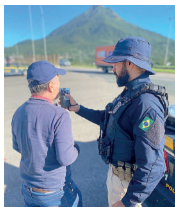
PRF faz recomendações aos motoristas

fatores como pista simples em grande parte do trecho, alto fluxo de caminhões, excesso de velocidade e ultrapassagens indevidas contribuem para o alto índice de acidentes.