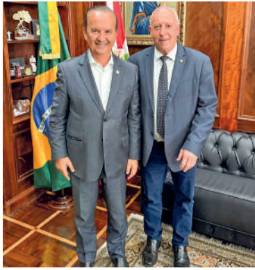
PRES. GETÚLIO concentra maior volume na região

Os recursos são resultado da articulação do parlamentar junto ao Governo do Estado de Santa Catarina, somados à destinação de emendas impositivas, contemplando áreas estratégicas como infraestrutura, saúde, agricultura e apoio