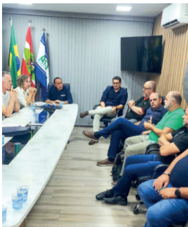
ENCONTRO foi realizado na Amavi

Durante a audiência, os técnicos detalharam o andamento dos projetos em execução relacionados à duplicação da