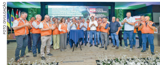
GOVERNADOR anunciou pacote de obras

PACOTE ENVOLVE R$ 133 MILHÕES em ações de limpeza, desassoreamento e melhoramento fluvial de rios