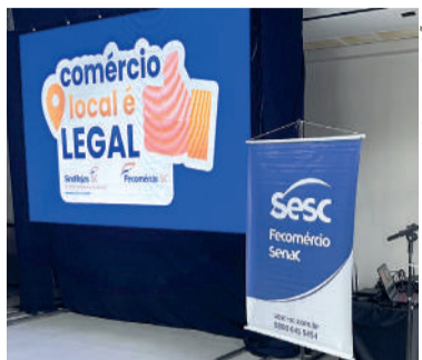
CAMPANHA visa fortalecer varejo