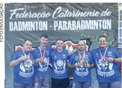
EQUIPE de Ibirama foi destaque

destaca o trabalho realizado pela APAE de Ibirama, que por meio do esporte estimula a participação, o desenvolvimento físico e a integração dos alunos em competições estaduais.