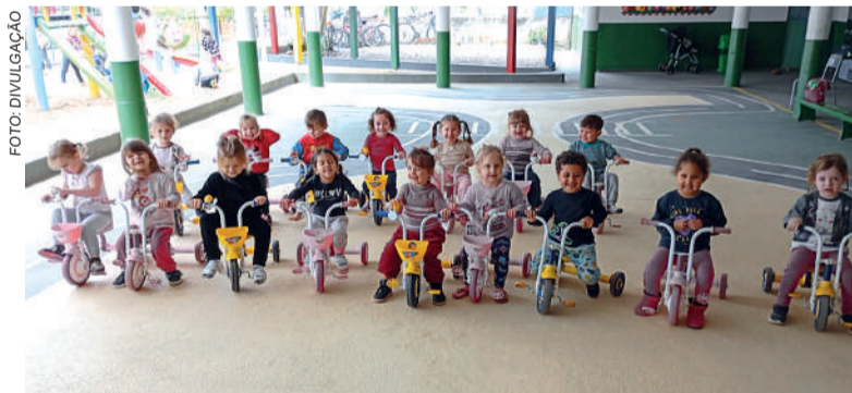
PROGRAMA apoiou 71 entidades em 2025

em https://investidor.bussolasocial.com.br/viacredialtovale .