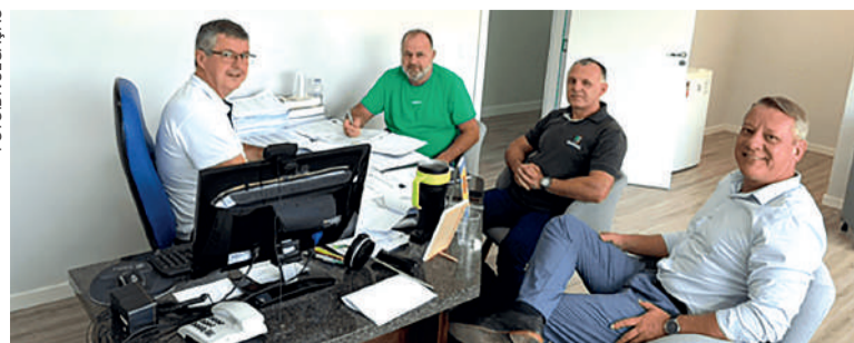
REUNIÃO ocorreu na sede da Ucavi

público para o provimento de vagas na Câmara Municipal”, destacou o presidente.