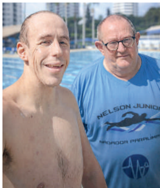
DISPUTA acontece de 27 a 29

Pai e filho retomaram juntos as atividades esportivas, em um processo que envolveu meses de tratamento, readaptação e treinamento