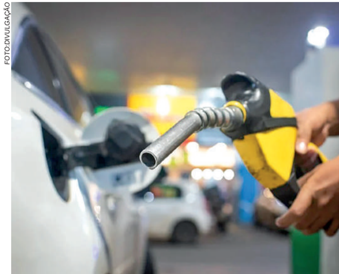
NÃO há confirmação de falta generalizada de combustível

JUSTIÇA FEDERAL DETERMINOU que caminhoneiros e entidades não bloqueiem ou dificultem o tráfego nas rodovias BR-101 e BR-470