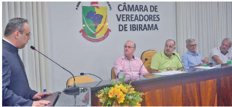
VEREADORES que votaram favoravelmente ao projeto enfatizaram o papel dos sinos como parte da identidade cultural

Ele ainda ressaltou que a prática não se restringe a uma única denominação. “Diversas igrejas utilizam sinos, cada uma dentro da sua tradição. Isso mostra que estamos falando de um elemento cultural amplo, que atravessa gerações”, com-