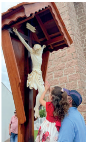
SÍMBOLO resgata tradição dos colonizadores

Conforme informações divulgadas pela Paróquia Santo Huberto, a tradição dos Cruzeiros de Caminho tem origem entre os séculos IV e VI, período em que o cristianismo começou a se expandir pela Europa após a liberdade religiosa concedida pelo imperador Constantino. Naquela época, cristãos passa-