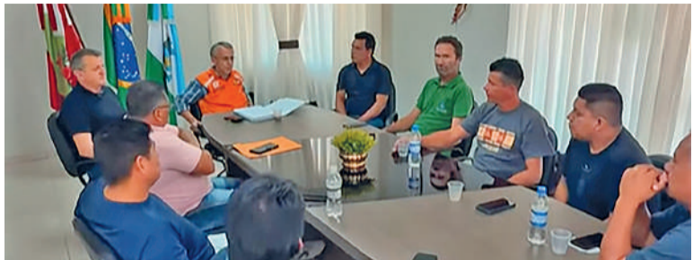
ENCONTROS visam reforçar diálogo com as comunidades

ESTADO TEM INTENSIFICADO O ACOMPANHAMENTO DA ESTRUTURA por meio da Secretaria de Proteção e Defesa Civil