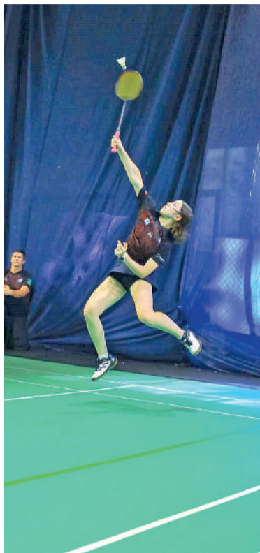
PROJETO reúne mais de 150 atletas de diversas idades

O projeto ganhou estrutura ao longo dos anos. Em 2014, passou a integrar as escolinhas da Prefeitura de Ibirama, por meio da Comissão Municipal de Esportes (CME). Dois anos depois, foi criada uma associação para fortalecer a organização e buscar recursos. “Em 2016 foi criada uma associação justamente com o objetivo de buscar recursos. A partir daí também houve maior envolvimento dos pais e das famílias no projeto”, explica o treinador.