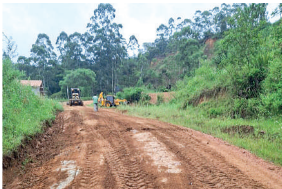
MANUTENÇÃO de estradas e roçadas continuam

“Nós sabemos que estamos um pouco atrasados, porque no verão é chuva e sol o tempo