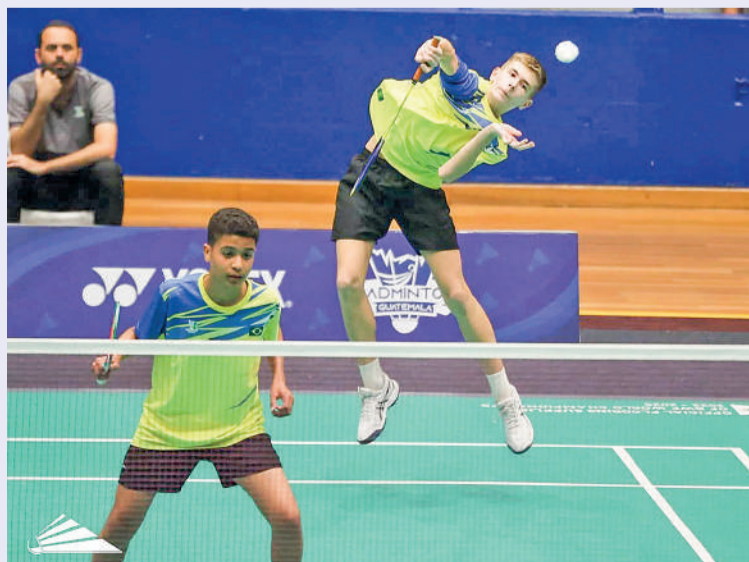
ATLETAS acumulam resultados nacionais e internacionais em competições oficiais

Segundo o treinador, esse ambiente colaborativo ajuda a fortalecer o projeto e contribui para que o nome de Ibirama ganhe destaque no cenário esportivo. “Hoje, no badminton brasileiro, todo mundo conhece Ibirama. Estamos levando o nome da cidade, da Udesc e do município para o Brasil e para o exterior, e isso nos orgulha muito”, conclui.