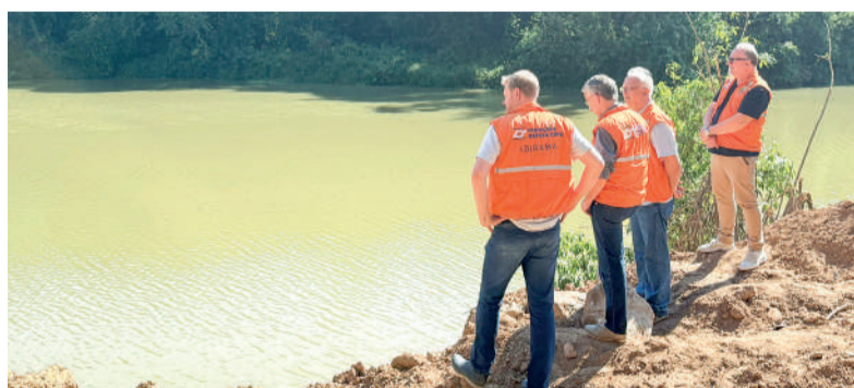
SECRETÁRIO de Estado realizou vistoria nas obras em Ibirama

Durante a vistoria, o prefeito destacou que as intervenções são necessárias para garantir mais segurança às famílias que vivem nas áreas afetadas. Essas intervenções são fundamentais para garantir a segurança da comunidade. Estamos trabalhando