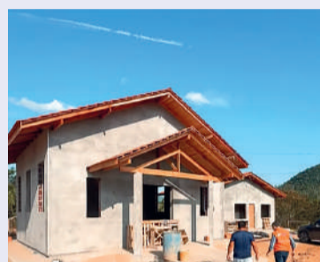
FOI iniciada a construção de 46 casas

“Graças à visão do nosso governador Jorginho Mello e ao apoio do governo, já iniciamos a construção de 46 casas de compensação para as comunidades indígenas. Além disso, também estão em obras bem