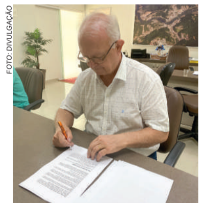
LANÇAMENTO DO EDITAL ocorreu na terça-feira, dia 25

Os interessados podem acessar o edital completo no portal: http://govgestao.com.br/1670fe .