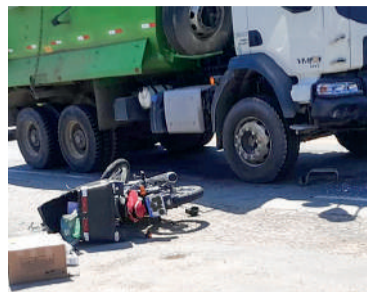
MOTOCICLISTA não resistiu aos ferimentos

Em Lontras, um terceiro acidente ocorreu na curva do Paredão, também na BR-470. A colisão envolveu uma motocicleta Yamaha/Fazer 250, um caminhão Scania/G 440 e um Jeep Compass. O motociclista, um homem de 32 anos, não resistiu aos ferimentos e morreu no local. O motorista do caminhão, de 41 anos, e o do Jeep, de 49 anos, não sofreram ferimentos.