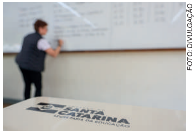
RECENTE REGULAMENTAÇÃO que restringe o uso de celulares nas salas de aula

A recente regulamentação que restringe o uso de celulares nas salas de aula está alinhada a uma lei federal e regulamentada pelo Conselho Estadual de Educação de Santa Catarina, visando melhorar a qualidade do ensino e a concentração dos alunos. Segundo a supervisora, estudos recentes demonstram