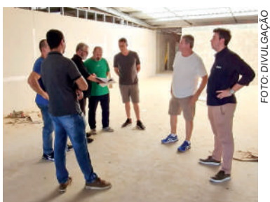
NOVA sede está sendo edificada em terreno doado pelo município

Atualmente, a APAE atende cerca de 160 alunos, um número que não para de crescer. "No começo, éramos 42 alunos, mas