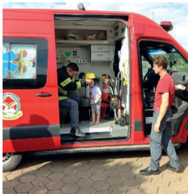
TEMA é reflexo da admiração das crianças pelos bombeiros

O tema escolhido para a comemoração foi bombeiros, reflexo da admiração que as crianças têm pela corporação. Chegando no local, os socorristas foram recebidos com alegria e entusiasmo pelos aniversariantes e seus convidados. Durante a