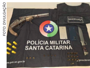
ARMA foi apreendida durante buscas no quarto

Após a abordagem, a guarnição deu voz de prisão ao homem e o conduziu ao Presídio Regional de Rio do Sul. Durante buscas no quarto do suspeito, os policiais localizaram uma espingarda calibre 20 de dois canos paralelos, além de uma