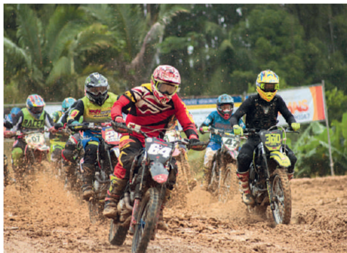
MAIS de 130 pilotos devem participar da competição

Com entrada gratuita, o evento deve atrair um grande público, que poderá acompanhar de perto as provas em um circuito técnico e desafiador. A pista de Ibirama é considerada uma das melhores do estado, oferecendo 100% de visibilidade para espectadores e pilotos. Além disso, conta com ampla área de box e uma nova torre de locução dentro do circuito, proporcionando melhor interação entre o locutor e o diretor de