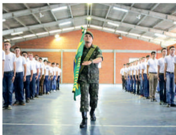
JURAMENTO à Bandeira será informado pela Junta Militar

Para alistar-se on-line o cidadão deve possuir cadastro na conta gov.br e acessar o endereço: alistamento.eb.mil.br. De posse de documento de identidade preferencialmente, deve inserir no cadastro as informações solicitadas. A confirmação do sucesso da finalização do seu alistamento aparecerá logo após o procedimento salvar as informações.