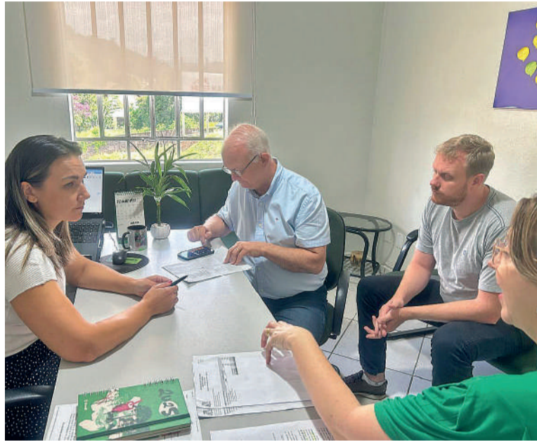
RECURSOS são resultados de viagens para Brasília

Esse investimento marca o início de um esforço contínuo para reduzir a demanda reprimida na saúde do município. No entanto, a expectativa é de que, dentro de seis a oito meses, a situação seja reavaliada para novas medidas para garantir a continuidade da re-