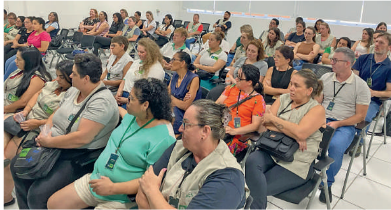
FORAM discutidas estratégias para aprimorar e fortalecer o SUS

“Os agentes comunitários de saúde são muito mais do que profissionais: são vizinhos, amigos e cuidadores que conhecem de perto as necessidades de cada família. Com es-