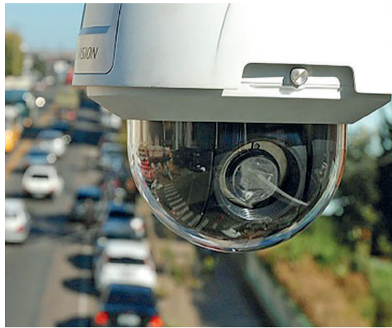
USO de câmeras OCR será um dos temas do encontro

câmeras captam as placas que identificam irregularidades do veículo e do proprietário: - número do Renavam (Registro Nacional de Veículos Automotores), chassi e da carteira de habilitação. O sistema OCR registra até 400 veículos por minuto.