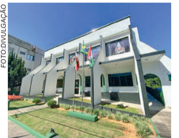
POPULAÇÃO pode participar

As metas fiscais são os resultados quadrimestrais, em valores correntes e constan-