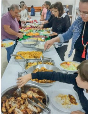
JANTAR terá o melhor da gastronomia típica

Os participantes poderão saborear um cardápio típico da culinária italiana, que inclui pratos como macarrão, polenta, fortaia (omelete típico italiano), galinha ao molho, galeto assado e sobrepaleta suína. O jantar ainda contará com acompanhamentos como arroz, legumes, frios, saladas e a