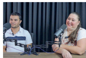
PREPARATIVOS para casamento estão a todo o vapor

A próxima edição da promoção já está sendo planejada,