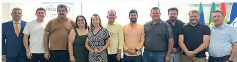
MANECA diz que fará pressão juntos aos representantes políticos