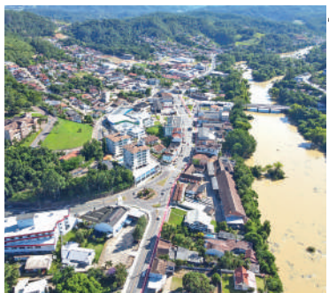
BOLETOS podem ser impressos no site ou retirados na prefeitura

Os boletos poderão ser retirados junto ao Departamento de tributação ou via site ibirama.atende.net/cidadao e podem ser pagos em agências lotéricas, bancos ou cooperativas bancárias. Também podem ser pagos via aplicativo, na modali-