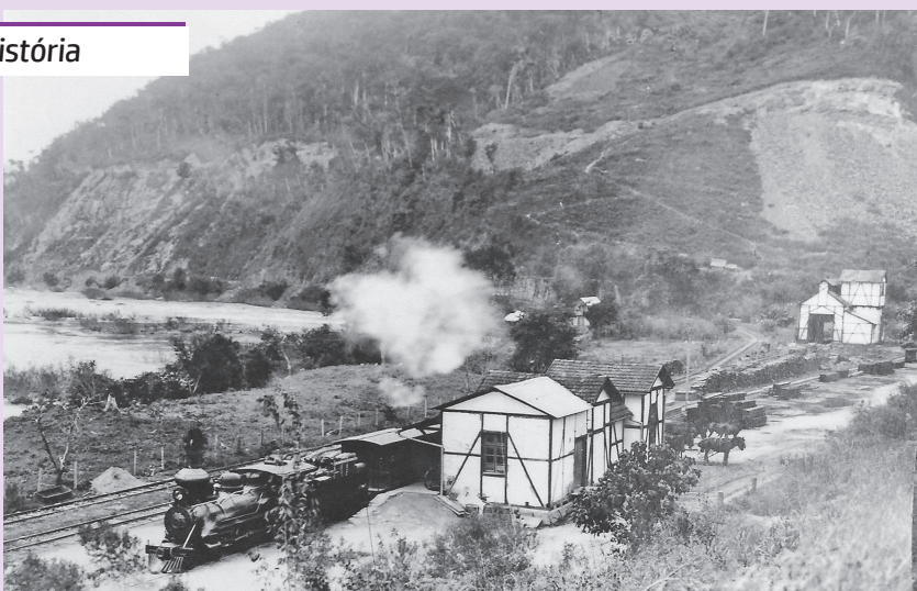
ESTAÇÃO DE HANSA NO ANO DE 1931 , onde também funcionava uma oficina para as locomotivas da EFSC. Estava localizada próximo onde hoje está a o trevo de acesso de Ibirama na Rua 25 de Julho (Rod Manoel Marchetti), em frente à ponte Hermann Baumann. (Ponte de Ferro). Tudo era em enxaimel. Tudo foi demolido. Hansa à época era o ponto final da EFSC no Km 70, em 1926, ainda um ponto perdido no Vale do Itajaí, inclusive sem energia elétrica.