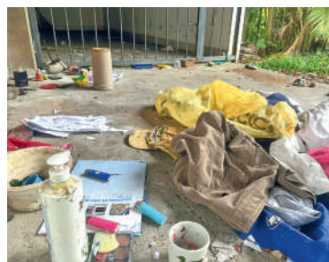
LIXO chegou a ficar acumulado no local