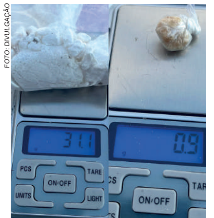
DROGAS foram apreendidas

Após a prisão, os dois homens foram encaminhados à Central de Plantão Policial de Rio do Sul, onde o flagrante foi formalizado. Posteriormente, eles foram levados ao Presí-