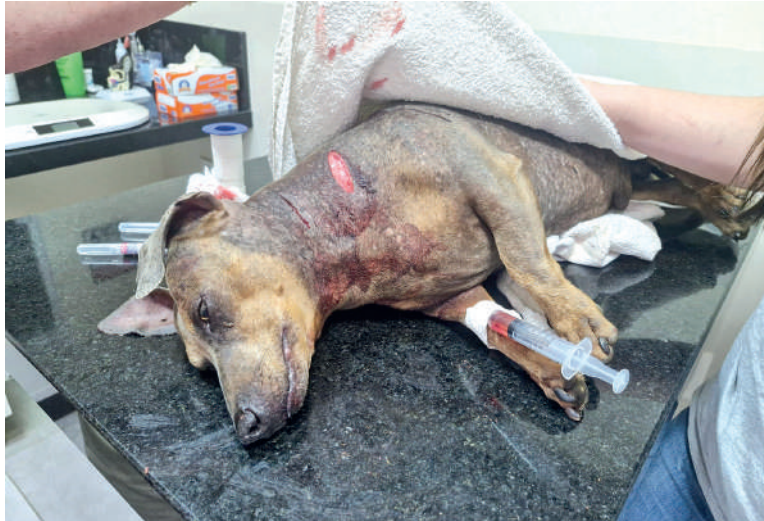
ANIMAIS foram medicados e passam bem