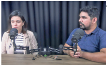
ENGENHEIROS explicaram programa

Os investimentos para garantir a modernização da iluminação pública dos municípios serão feitos