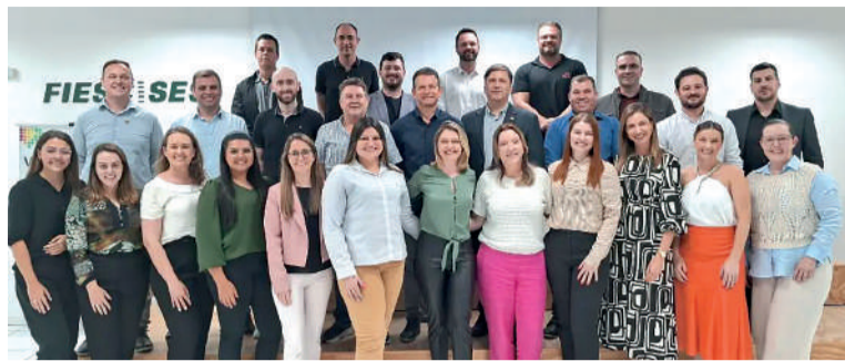
EVENTO promoveu discussões sobre o fortalecimento regional

A Associação Empresarial de Ibirama (ACIIBI) realizou durante as eleições, a entrega da cartilha "Voz Única" aos candidatos a prefeito do município. O documento, que faz parte de uma iniciativa do Sistema FACISC — um movimento apartidário