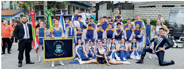
FANFARRA de José Boiteux é destaque na competição

Essas vitórias reafirmam o compromisso de José Boiteux com o desenvolvimento cultural e a excelência musical,