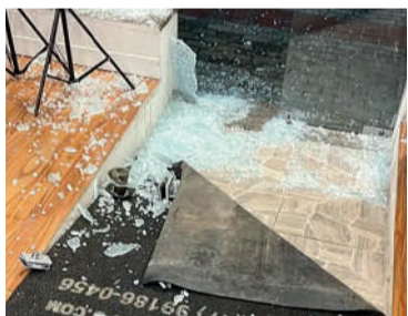
LOJA foi furta no domingo

mandado, os policiais localizaram 10 aparelhos celulares, que o suspeito confessou ter furtado dos estabelecimentos comerciais. Também foi cumprido um mandado de prisão preventiva contra ele, referente a um furto investigado na cidade de Blumenau.