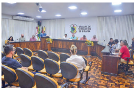
NORMAS passam a valer no próximo ano

NOVA VERSÃO DO REGIMENTO estará disponível para consulta pública no site oficial da Câmara