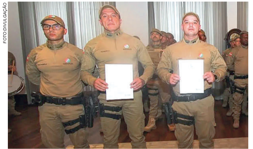
POLICIAS atuaram na identificação e prisão de autor de feminicídio