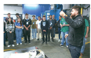
OBJETIVO é trazer desafios

irão acontecer durante três meses, mas a primeira ação já foi realizada, com visitas técnicas nas indústrias Bovenau e Rioar Automação Industrial. As demais visitas acontecerão nos próximos dias, na Folini Têxtil, Ical, Riosu-