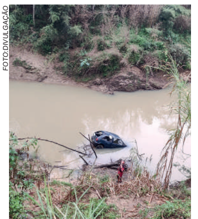
HOMEM não se feriu

Felizmente, ele está bem e não sofreu ferimentos graves. O veículo, que tem placas de Ibirama, havia saído da pista e caído no rio, mas o homem conseguiu sair do local por conta própria e se dirigir para casa.