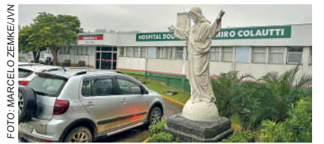
PACIENTES devem ficar atentos à ação dos golpistas

ou mensagem suspeita, o hospital orienta que a pessoa entre em contato imediatamente com a instituição para confirmar a veracidade da informação antes de tomar qualquer ação.