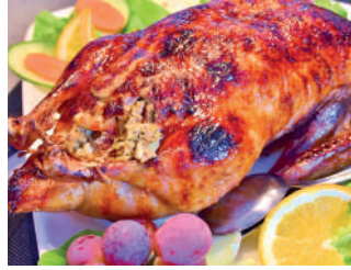
MARRECO serve em média, 4 pessoas

A partir das 14 horas, a festa continua com uma tarde dançante, com a Banda Elyte, que promete agitar o público até às 18 horas. A entrada é franca, garantindo que todos possam participar e se divertir. “A animação será garantida, e a comunidade está preparada para receber