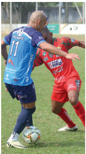
CRUZEIRO volta neste domingo contra o União

CELESTE RECEBE o União de Taió no Estádio Bernardo Müller neste domingo dia 8