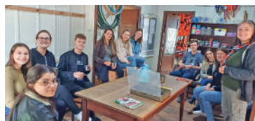
OBJETIVO é contribuir na formação dos acadêmicos