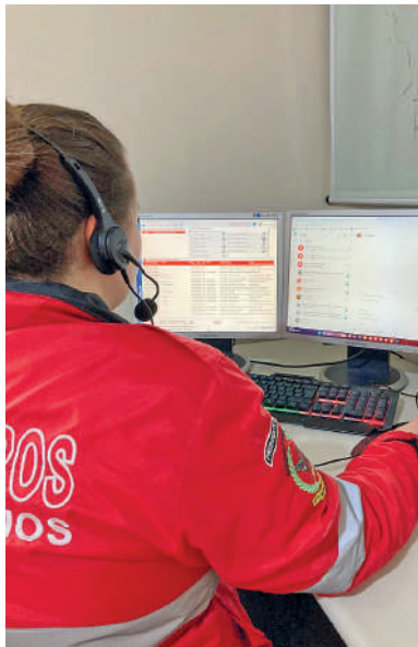
WHATSAPP substituiu o X

Esses grupos oferecem as mesmas atualizações em tempo real e informações sobre ocorrências, alcançando um grande número de pessoas. A corporação reafirma seu compromisso de manter a população bem informada através de sua central de operações e assessoria de comunicação social e imprensa.