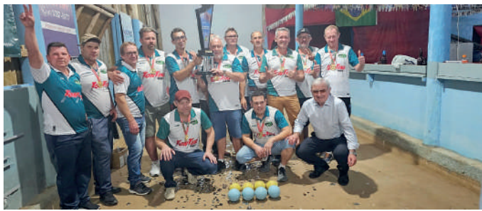
EQUIPE sagrou-se bicampeã do torneio