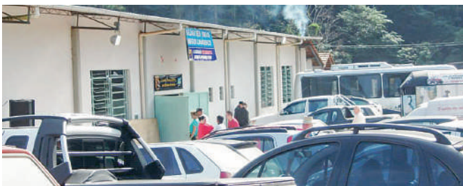
FESTA do Pato acontece no domingo