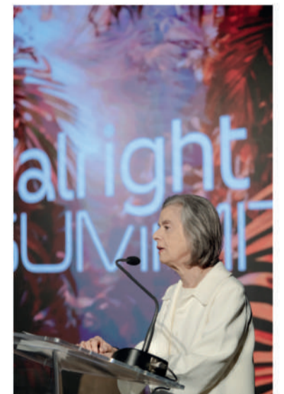
CARMEN LÚCIA, MINISTRA DO STF