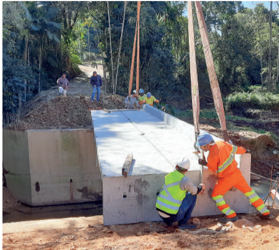
LOCALIDADES reverberam kits de transposição da Defesa Civil

Em grande parte as carretas foram guinchadas por uma motoniveladora do município, devido aos trechos íngremes da região. “Foi um trabalho de logística planejado, com diversas intervenções para acesso das carretas e do guindaste. Mas, o trabalho foi concluído, a comuni-