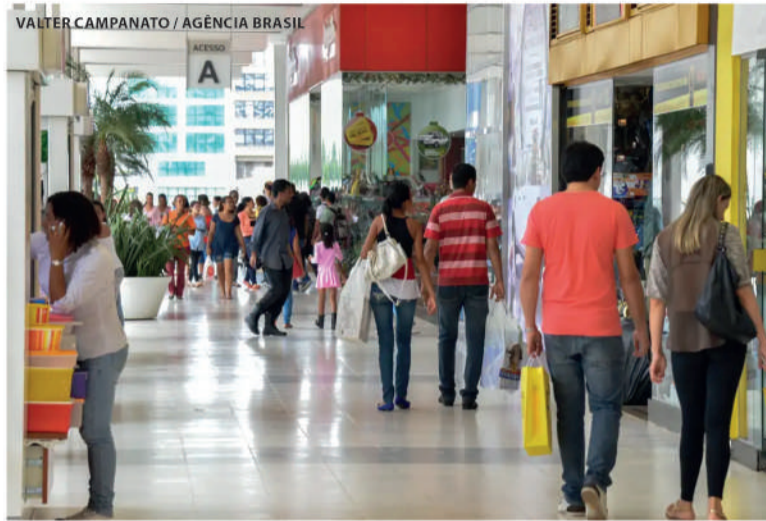
As lojas físicas foram as responsáveis pelo maior retorno financeiro neste ano

Em relação ao mercado de trabalho, a maior parte dos empresários (98,4%) relatou não ter contratado colaboradores para o período. Entre os que realizaram contratações, a média foi de apenas um funcionário. “Esse comportamento pode ser