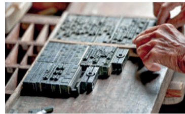
IMPRESSO evoluiu com o passar dos anos, mantendo a seriedade

Ao longo de suas seis décadas, o Jornal Vale do Norte cobriu todos os fatos relevantes que marcaram Ibirama e sua região. O jornal desempenhou um papel fundamental no crescimento do município, garantindo conquistas importantes e sempre mantendo seu compromisso com a verdade e a responsabilidade de informar. Mesmo diante de diversas mudanças