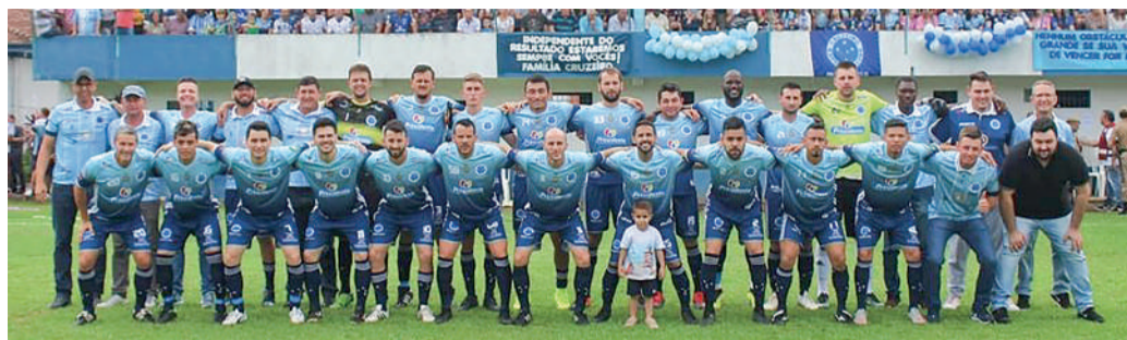
CRUZEIRO possui histórico vitoriosos na competição

A partida de abertura será contra o Tamandaré, de Laurentino, e está marcada para as 10h no Estádio Bernardo Muller, em Presidente