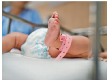
CASO aconteceu em 1973

Conforme destacado, duas mulheres ibiramaenses, que buscavam reparação judicial pelo erro que ocorreu no Hospital e Maternidade Miguel Couto, incorporado à Fundação Hospitalar de Santa Catarina, e administrado na época pelas irmãs da congregação "Franciscanas" de São José. O hospital funcionava onde hoje está a Associação Hansahöhe. O Estado de Santa Catarina devolveu o prédio para a comunidade em 1986. Na época, uma das mulheres decidiu colaborar com a reportagem, mas com uma condição: sem nomes. "Sem nomes por favor! Mesmo assim, a grande maioria já sabe de quem se tra-