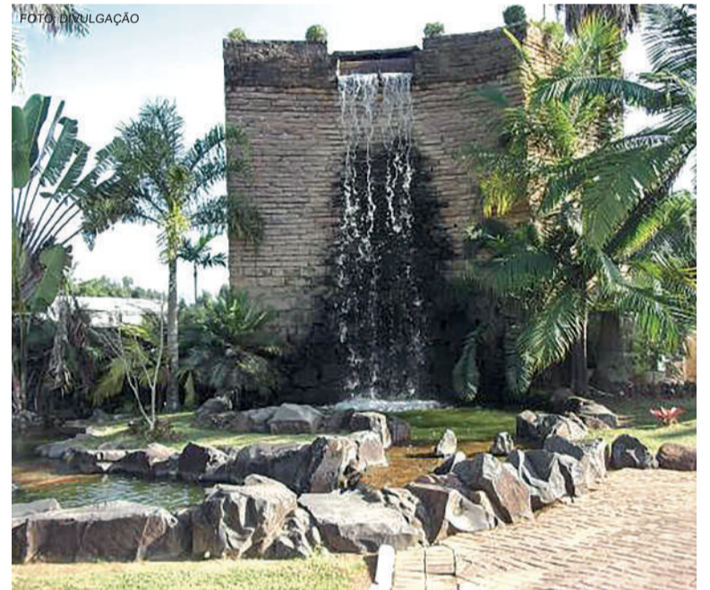
EVENTO acontece na Praça Otto Müller neste sábado, dia 31