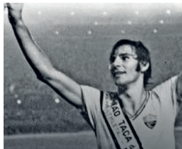
GETULIENSE foi destaque no Flu

Recebemos com muita tristeza a notícia do falecimento do ídolo Mickey, o artilheiro paz e amor, autor do gol que nos levou ao nosso primeiro título brasileiro em 1970. Pelo