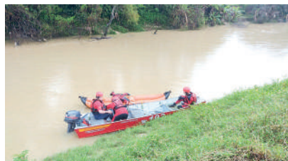
JOVEM teria tentado atravessar rio a nado

gadas pelos bombeiros, as equipes de Presidente Getúlio e Ibirama retornaram para o local do ocorrido, iniciando as ações na tentativa de encontrar o corpo, quando já no início da operação, o corpo do jovem foi encontrado.