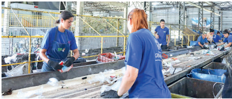
LIXO reciclável é separado em cooperativa

Os resíduos não recicláveis, como restos mortais de animais, não devem ser colocados nas embalagens ama-