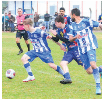
PRIMEIRA Ida ficou no 0 x 0