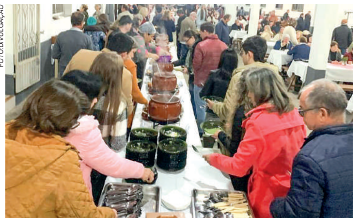
EVENTO foi realizado no salão da Comunidade Evangélica de Ibirama

A “Noite das Sopas e Risoto” se consolidou como um evento de sucesso, demonstrando o engajamento e a união da comunidade, além de atrair visitantes de outras localidades, contribuindo para o fortalecimento e a expansão das atividades da Comunidade Evangélica Luterana de Ibirama.