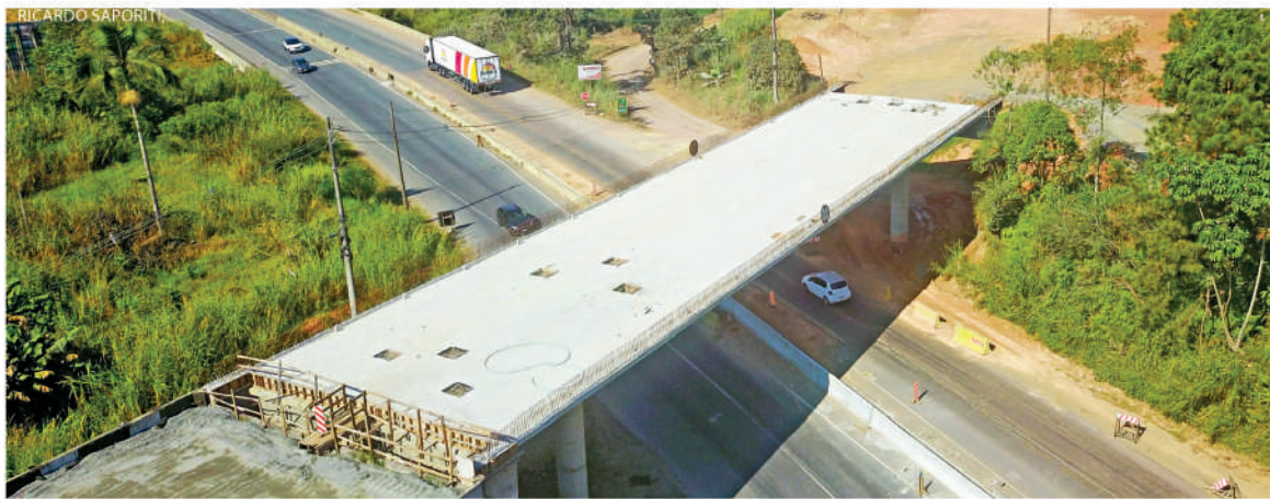
Estudo da Fiesc também aponta defeitos na pista no trecho já concluído, mesmo com as precauções técnicas adotadas

O documento, elaborado no início do mês de junho, faz uma análise sucinta da situação física das obras e serviços