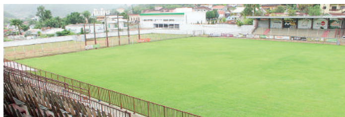
ESTÁDIO da Baixada será palco da disputa neste sábado

A torcida do Santa Catarina Clube terá praticamente 800 ingressos à disposição para o jogo de domingo, dia