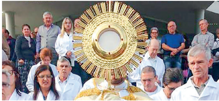
CELEBRAÇÃO volta a ser realizada na igreja matriz, no Centro

tregues em todas as 14 comunidades até o dia 29 de maio. Na igreja matriz, as doações serão aceitas até o dia 30 de maio, durante a celebração.