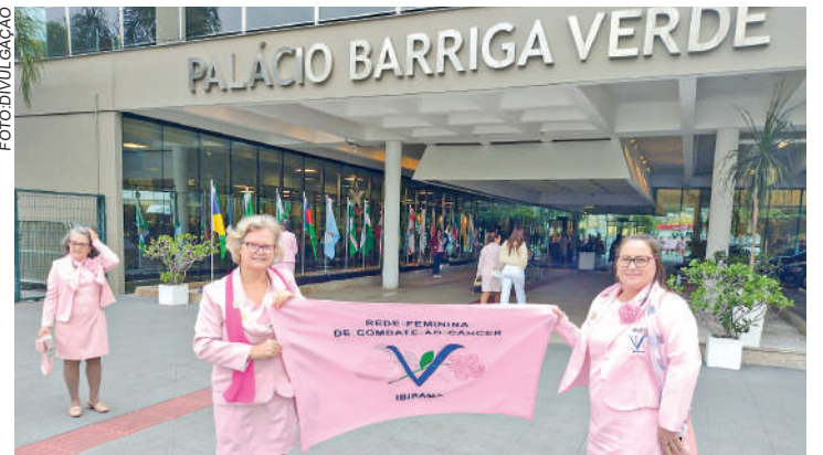
ATUALMENTE são 82 Redes em Santa Catarina

O evento também foi momento de reconhecer o importante trabalho desenvolvido pela Rede Feminina em toda Santa Catarina. Hoje, são 82 Redes e mais de 6 mil voluntárias atuando nas mais diversas regiões do estado. Um dos principais objetivos das chamadas "rosinhas" é trabalhar para prevenir o câncer e ainda apoiar e orientar as mulheres que enfrentam a doença.