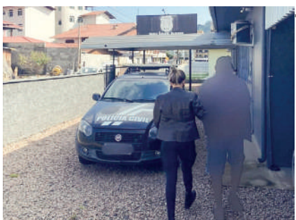
ELE foi encaminhado ao presídio

Com base nas informações recebidas, foram realizadas diligências que resultaram na interceptação do suspeito. Ele foi localizado enquanto andava de bicicleta no centro da cidade. O homem foi conduzido à