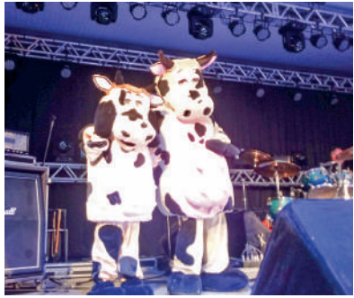
GETULINA e Mimosinha são as mascotes da festa

ainda com o intuito de ajudar as pessoas do Rio Grande do Sul, a entrada para o show de sexta-feira (Marcos e Belutti) será 1 kg de alimento não perecível ou água”, assinala. Tanto a entrada ao parque quanto de todos os shows, serão gratuitas”.