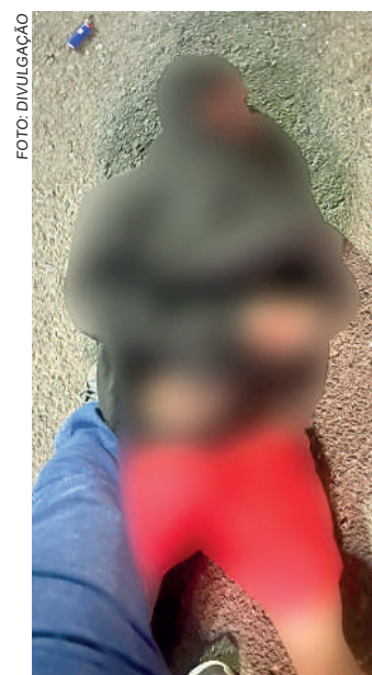
POLICIAIS de folga se depa-raram com o homem

Preso, o indivíduo permanecerá à disposição da justiça no Presídio Regional de Rio do Sul.