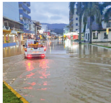
PRES Getúlio sofreu mais uma vez com alagamentos

Vale lembrar que desde o último dia 11 de maio foi dado início o processo de dragagem do Rio Itajaí-Açu. A ação prevê melhorias que visam mitigar e prevenir as cheias no Alto Vale do Itajaí, região que de forma recorrente é uma das mais atingidas em Santa Catarina. A medida é uma forma de evitar que cenas como a das