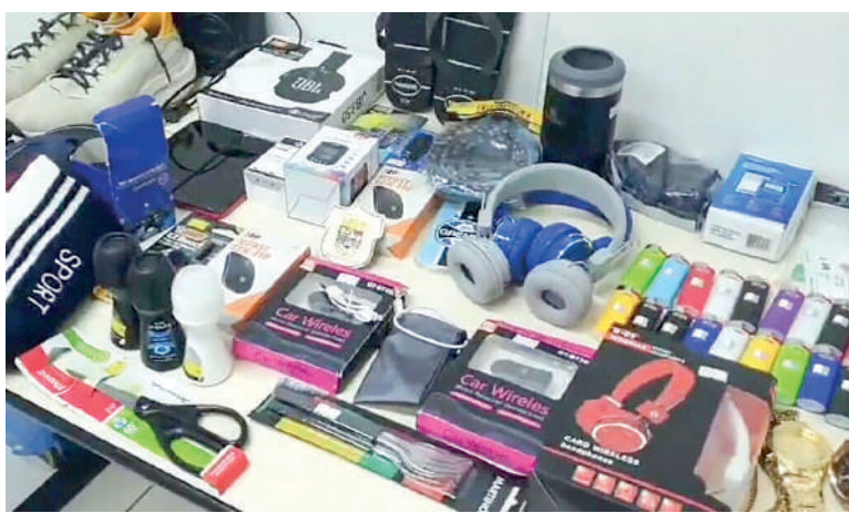
INTENS furtados de comércio de Ibirama foram recuperados após perseguição pelas ruas de Blumenau

Imediatamente os proprietários acionaram a Polícia Militar,