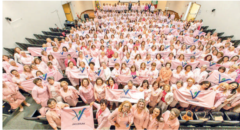
PRIMEIRA RFCC foi criada em Florianópolis em 1961