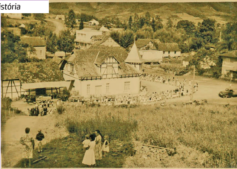
PROCISSÃO DE CORPUS CHRISTI, vista do pátio da Igreja São Pedro e São Paulo, no Distrito de Dalbérgia em Ibirama. A foto é de meados da década de 50 e em primeiro plano está a Sociedade Cooperativa Hansa.