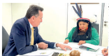
INTENÇÃO é acelerar obras de recuperação da Barragem Norte

Apesar de ser a maior do Estado, a barragem segue sem manutenção devido a um impasse com