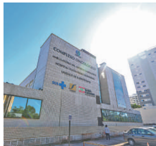
CEPON realizou 539 consultas

Segundo o INCA, em 2024 a doença deve afetar 650 pessoas em Santa Catarina, sendo 60 casos em Florianópolis. Por isso, medidas simples como manter uma boa higiene bucal,