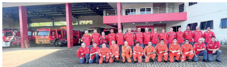
GRUPAMENTO se deslocou para o estado vizinho para permanecer até o domingo, dia 11

O grupamento se deslocou para o Estado vizinho neste domingo, 5 de maio. No início das atividades, estará estabelecido na unidade dos Bombeiros Voluntários de Rolante, município com 21,1 mil habitantes, localizado na região Nordeste do Estado, no Vale do Paranhana, distante 90 km da capital Porto Alegre. A previsão inicial é de permanecer naquela região por sete dias.