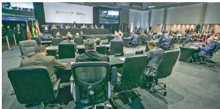
PARA DEPUTADO , informações sobre barragens são de pouca transparência

Com o objetivo de promover a transparência da operação, manutenção e das medidas de segurança das barragens a proposta prevê, entre outras ações, que órgão estadual fiscalizador realize inspeções regulares