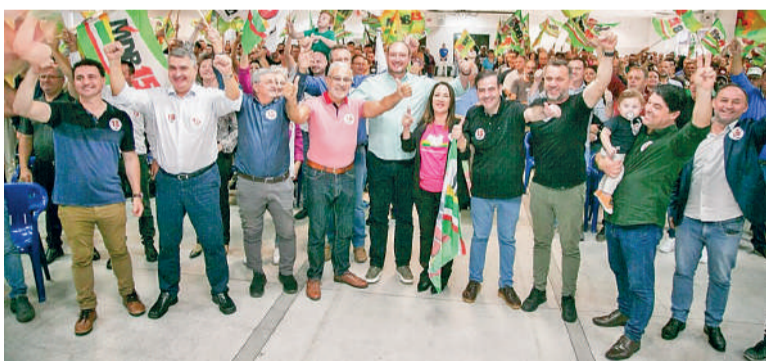
BORA 15 foi o primeiro evento regional do MDB

O Bora 15 – Mobiliza MDB em Rio do Sul reuniu também as coordenadorias regionais do MDB de Taió, Ituporanga, Ibirama e Timbó, totalizando 38 municípios. “Nós não somos um partido de extremos, somos um partido de entregas. O MDB é o diálogo, é o centro,