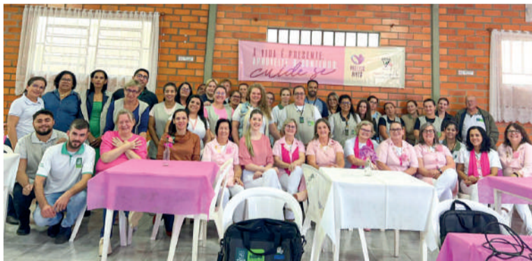
RFCC desenvolve ações em parceria com a Secretaria de Saúde

REDE FEMININA DE COMBATE AO CÂNCER aderiu novamente a campanha nacional Preciso Viver