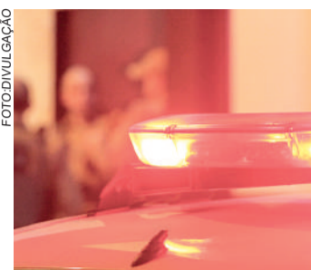
SUSPEITOS foram encontrados em Apiúna

Dentro da residência, a polícia encontrou quase to-