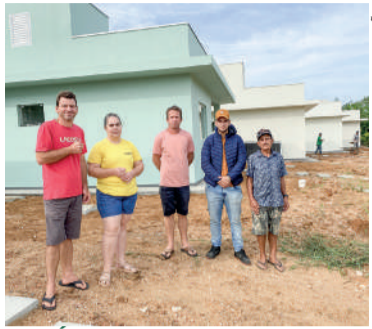
FAMÍLIAS foram atingidas pela enxurrada de 2020

Cinco famílias que tiveram os imóveis destruídos pela enxurrada que ocorreu em dezembro de 2020 em Ibirama, na manhã desta quarta-feira, 8, puderam conhecer suas novas casas. Após uma reunião no gabinete do Centro Administrativo Ivo Muller, onde foi feito o sorteio da ordem das casas, os representantes das famílias foram até o bairro Progresso onde puderam entrar pela primeira vez nos imóveis.