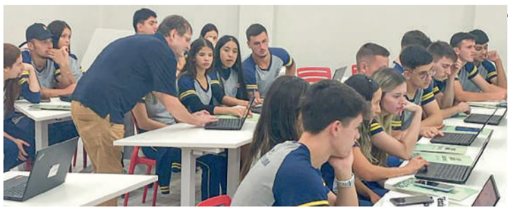
ALUNOS da EEB José Clemente Pereira, participaram do programa

Os alunos participaram de oficinas dos três cursos de graduação da Udesc Alto Vale e tiveram contato com labora-