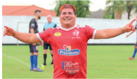
TUPY VENCEU o Unidos Alto Vale

Na quarta posição, temos o E.C. Tupy, com 7 pontos, seguido de perto pelo Primavera E.C. e Unidos Alto Vale, ambos com 6 pontos. Após perder 6 pontos por suposta escalação irregular de atletas, o Primavera desceu até a