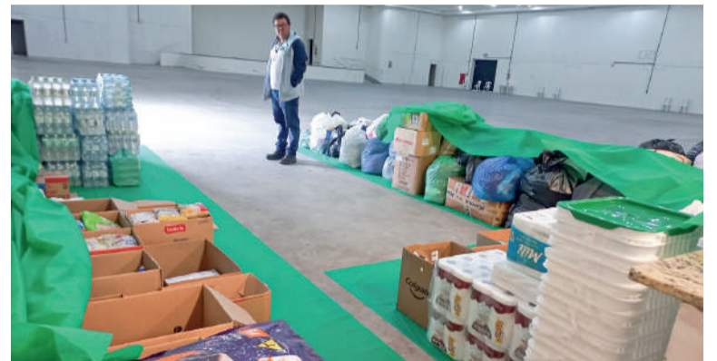
DOAÇÕES estão sendo concentradas no Pavilhão Manoel Marchetti

Presidente Getúlio, Vitor Meireles, Dona Emma e José Boiteux”, explicou.