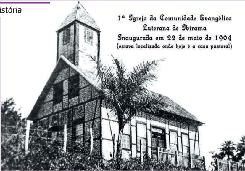
1ª Igreja da Comunidade Evangélica Luterana de Ibirama Inaugurada em 22 de maio de 1904 (estava localizada onde hoje é a casa pastoral)

PRIMEIRA DA COMUNIDADE EVANGÉLICA LUTERANA DE HAMMONIA, inaugurada em 22 de maio de 1904, onde hoje está a Casa Paroquial. A primeira igreja também serviu de escola. 13 anos depois, em 31 de outubro de 1917, foi colocada a pedra fundamental no novo santuário e, em 25 de maio de 1929, foi efetuada a consagração da Igreja Martin Luther.