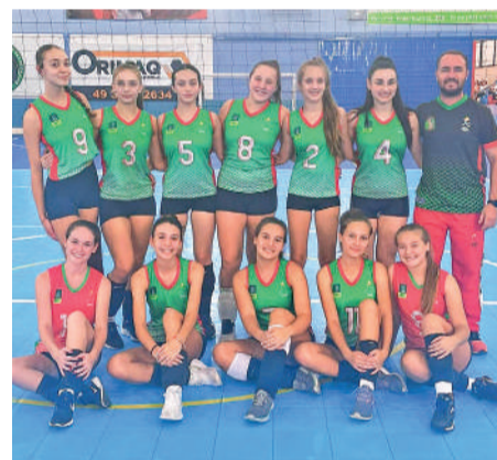
EQUIPE competiu em Curitiba

São cinco equipes participantes em grupo único, com todas se enfrentando entre si. Além de Ibirama, também confirmaram participação no evento