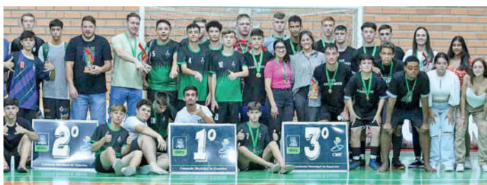
CAMPEÕES foram premiados em Dalbérgia

17 anos, o Instituto Federal Catarinense (IFC) marcou um total de 148 pontos e assegurando o primeiro lugar. A EEB Gertrud Aichinger ficou com a segunda posição, acumulando 70 pontos,