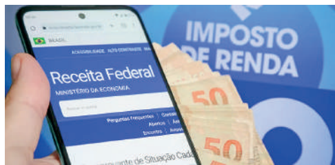
DECLARAÇÃO segue até o dia 31 de maio