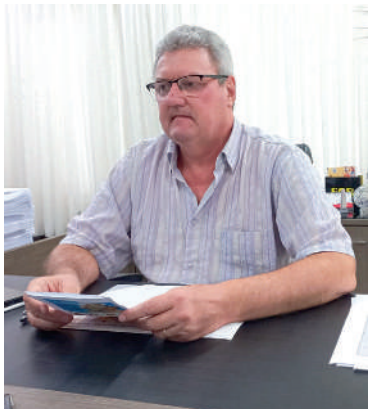
PICO elencou obras no município

Entre as obras de destaque em 2024 estão a pavimentação de 1.100 metros da Rua Treze de Maio. A obra terá um investimento total de R$ 2.409,973,60. “É um sonho que estamos realizando. É um dos projetos que conseguimos colocar em prá-