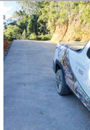
SERRA recebeu pavimentação

Pico também destacou as obras no Ginásio Municipal de Esportes e as pavimentações em andamento no município, com atenção para todos os bairros. Por fim, o prefeito agradeceu o apoio da comunidade e reafirmou seu compromisso de continuar trabalhando incansavelmente até o último dia de seu mandato para garantir um futuro ainda mais promissor para o município. “Somente em investimentos em obras, máquinas e equipamentos, acedido de deva passar dos R$30milhões em quatro anos”, concluiu Pico.