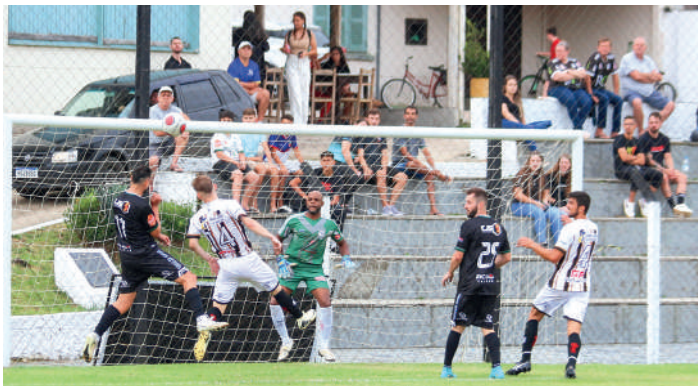
COMPETIÇÃO tem o apoio da CME de Ibirama

No Campo do Vera Cruz, o P.S.G./Carneiro Montagem enfrentará o Guarani