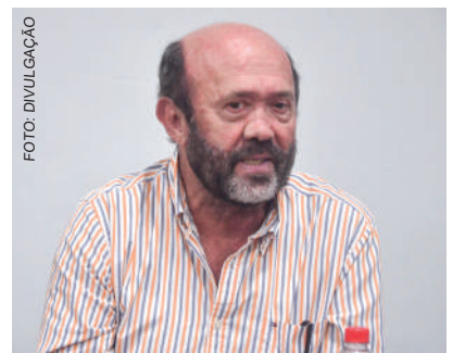
DIRETOR sugeriu investimento em lâmpadas LED

Em atendimento ao questionamento dos vereadores quanto ao grande número de lâmpadas quei-