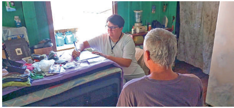
CONFERÊNCIA de dados e mudança de beneficiários estão entre os motivos

ram cancelados 3 cadastros do Bolsa Família por falecimento do beneficiário, além de oito desligamentos voluntários, solicitados pelas famílias que saíram da situação de vulnerabilidade.