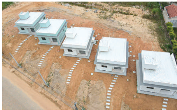
TOTAL investido nas obras foi de R$ 620mil

O investimento por parte do Governo de Santa Catarina foi de R$ 420 mil, com contrapartida do município de Ibirama de R$ 200 mil, com total de R$ 620 mil. Os imóveis possuem 50,36 metros quadrados de área construída