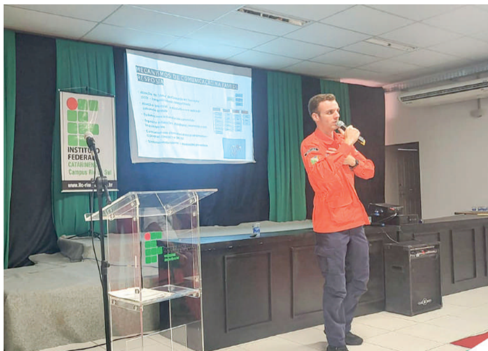
TEMAS foram tratados com secretários de defesa civil e técnicos do setor

RFCC está junto ao Parque de Eventos Manoel Marchetti, numa área cedida pela Prefeitura, além da casa enxaimel que abriga o tradicional brechó da entidade.