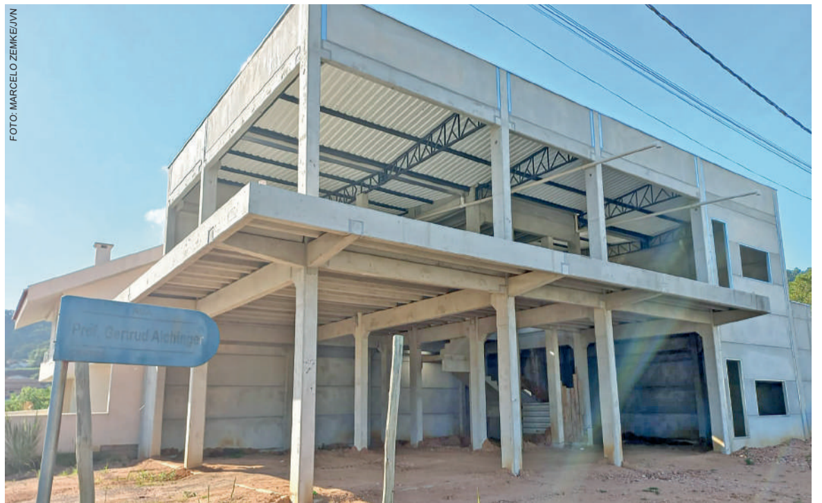
RFCC aguarda emendas parlamentares que foram aprovadas no ano passado

RFCC está junto ao Parque de Eventos Manoel Marchetti, numa área cedida pela Prefeitura, além da casa enxaimel que abriga o tradicional brechó da entidade.