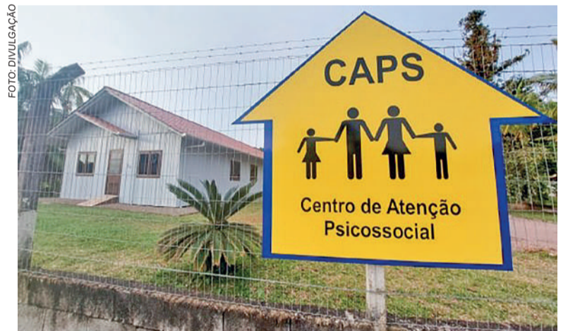
CAPAS de Presidente Getúlio está localizado no Bairro Pinheiro

A unidade está localizada no bairro Pinheiro, rua Traugott Muller, 730. O telefone é o 3352-0771.