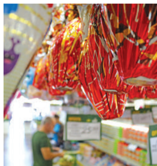
COMERCIO de bazar estará aberto no sábado à tarde

Além disso, no Distrito de Dalbérgia, uma ação especial está programada: a entrega de 300 ovos de Páscoa, como parte da promoção Páscoa Encantada, realizada pela Câmara de Dirigentes Lojistas de Ibirama (CDL). A caça aos ovos foi uma das principais atrações pro-