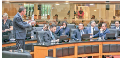
PROJETO já recebeu parecer favorável da CCJ

“O aumento da violência e a sensação de insegurança no ambiente escolar gerada por ataques como o de Blumenau vêm deixando pais, professores e estudantes apreensivos. Embora diversas medidas