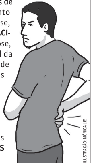
ILUSTRAÇÃO: MÔNICA LIE

Problema que acomete muitos SEDENTÁRIOS , os desvios posturais se caracterizam por ALTERAÇÕES anormais nas curvaturas da coluna VERTEBRAL , podendo provocar DORES nas costas e uso indevido de outras articulações do corpo para manter o EQUILÍBRIO . Os principais tipos de desvio são a HIPERLORDOSE , que consiste no aumento do grau da CURVATURA da coluna lombar; a hipercifose, em que o aumento da curvatura se dá na coluna TORÁCICA , dando a impressão de uma CORCUNDA ; e a escoliose, que consiste num desalinhamento e DESVIO lateral da coluna em seu próprio EIXO , formando uma sinuosidade semelhante à letra "s". Além de causar desconforto, os desvios POSTURAIS podem gerar pressão nas vértebras, e encurtamento e enrijecimento dos MÚSCULOS . Quanto antes o problema for identificado, mais fácil será seu tratamento, que pode envolver FISIOTERAPIA , mudança de hábitos e inclusão de atividades FÍSICAS regulares na ROTINA do paciente. Em casos mais graves, pode ser necessário fazer uso de COLETES ou até mesmo passar por uma intervenção cirúrgica.