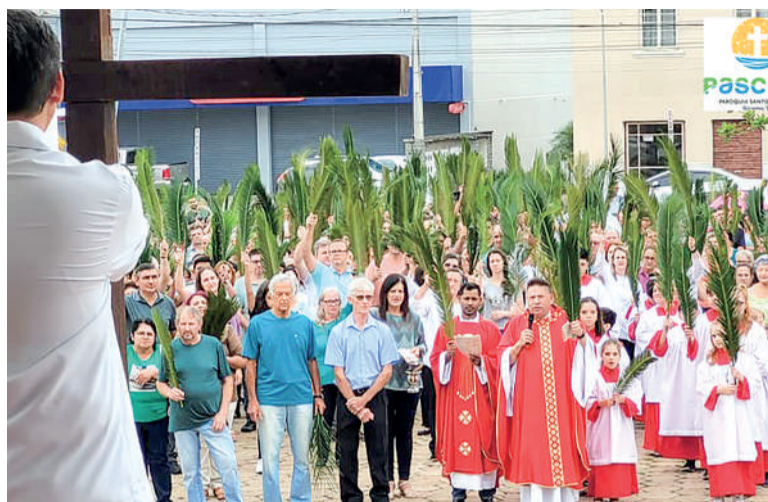
SEMANA SANTA foi aberta no Domingo de Ramos, dia 24, e encerra com a celebração da Páscoa