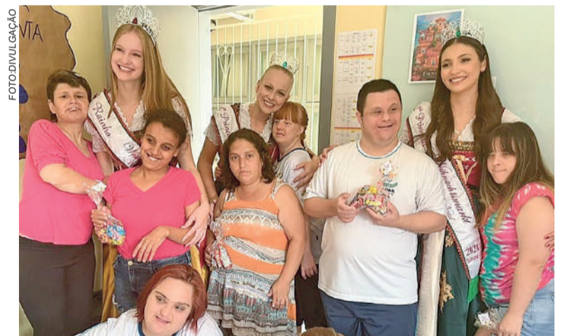
KITS de Páscoa foram entregues para os alunos