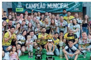
TIGRES campeão no Ouro