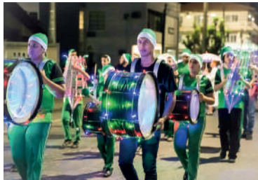
DESFILE de abertura foi realizado na sexta-feira

Para as crianças, haverá visita à Casa do Papai Noel durante o horário de aula. A ação contempla estudantes de CEIM's e escolas da Rede Municipal e Estadual. A Casa estará aberta também as sextas, sábados e domingos, do dia 01 ao 22. E, dos dias 11 a 14, o bom velhinho vai até as localidades do interior, espalhando mais o espírito do Natal através do projeto Papai Noel nas Comu-