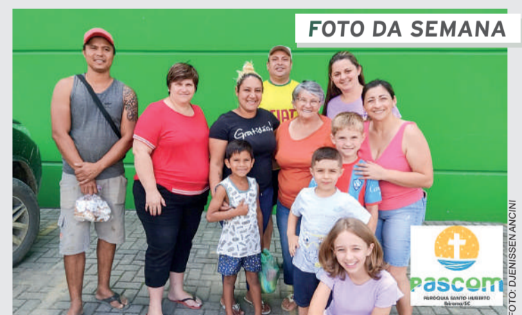
FOTO DA SEMANA

O GRUPO DE ORAÇÃO DA IGREJA SÃO JOÃO BATISTA dos bairros Nova Stettin e São Cristóvão, reuniu doativos aos desabrigados das cheias de Rio do Sul. Foi realizada distribuição para duas famílias e dois abrigos. As lideranças da comunidade agradecem a todos que colaboraram. Que Deus abençoe a todos envolvidos.