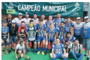
PRIMAVERA campeão no Prata