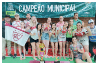
CAHA campeã no Feminino

TIGRES, PRIMAVERA, ATLÉTICO E RC CONFECÇÕES sagraram-se vitoriosos