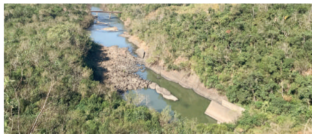
COM proposta, Celesc passaria a operar Barragem Norte

Uma vez identificada a viabilidade dos potenciais de geração de energia, a Celesc faria as adequações necessárias e passaria a operar as barragens. "O gerenciamento das barragens é uma necessidade, porque a gente sofreu tanto agora nas cheias, que nós estamos passando as barragens para serem supervisionadas e geren-