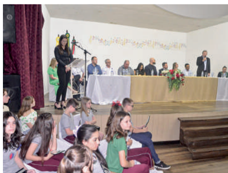
ALUNOS e professores foram homenageados

Foram entregues troféus para os alunos dos ensinos fundamental e médio, para orgulho dos professores e familiares presentes. A indicação dos alunos com melhor média de notas e compor-