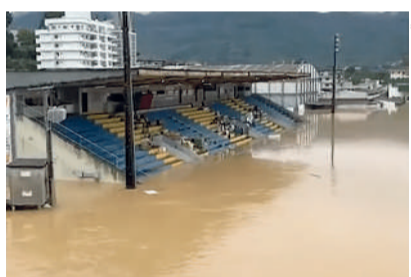
ESTÁDIO ALFREDO JOÃO KRIECK teve campo e parte arquibancada inundados na enchente do dia 18/11

O evento aconteceria na capital do Alto Vale pelo segundo ano seguido entre 29 de novembro a 9 de dezembro, envolvendo diversos locais de competição e cidades da região. Para justificar o pedido, o município citou os dois decretos de calamidade pública, além dos 15 locais de competição que foram duramente afetados pelas cheias e as escolas estaduais e municipais que também foram atingidos. Outras cidades da região que tam-