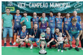
RC CONFEC. campeão no Veteranos

Marcelo Zemke noticias@jornalvaledonorte.com.br