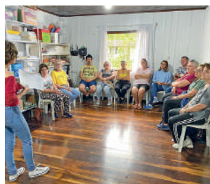
PACIENTES participaram de atividade com psicóloga

Durante o ano, a rede pública de saúde segue dando suporte aos pacientes que precisam de apoio psicológico. Além do Caps, que realiza atendimento psicológico individual, atendimento