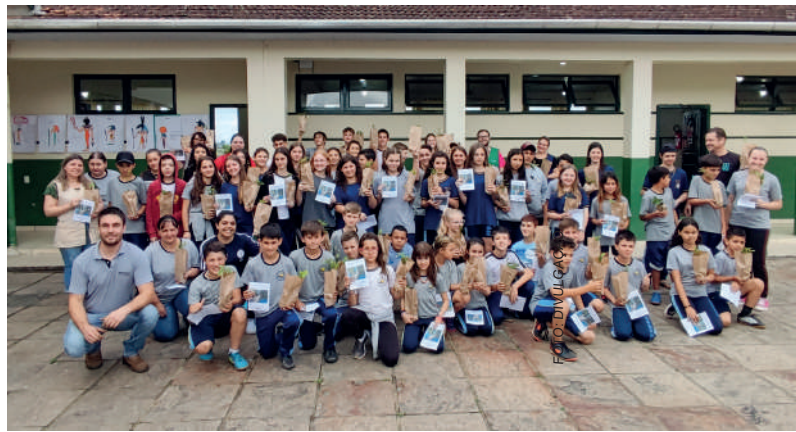
MAIS de 120 alunos foram atendidos nos municípios de Ibirama e Dona Emma

Na Tancredo Neves em Ibirama, e na escola Professora Maria Angélica Calazans em Dona Emma, foram atendidos com palestras, 60 alunos em