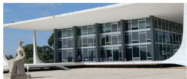
FIESC defende que decisão do STF desconsidera diferenças

A decisão do STF desconsidera as diferenças regionais brasileiras. “No caso de Santa Ca-