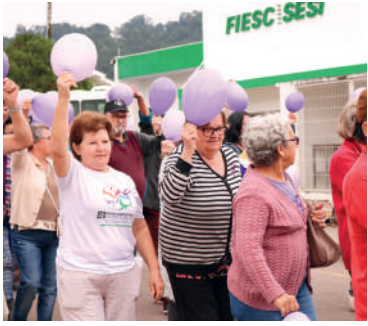
FESTA será realizada na terça-feira, dia 3, Pavilhão Manoel Marchetti

PARA CELEBRAR A DATA , as atividades iniciam no domingo, 1º de outubro