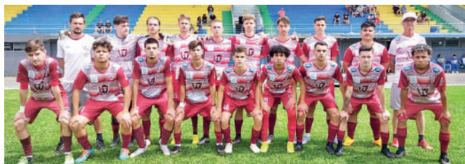
EQUIPE venceu o Choco Esportes de Joinville nas penalidades

A equipe Sub- 18 do projeto Meninos da Baixada (Clube Atlético Hermann Aichinger) conquistou a terceira colocação na Primeira Copa Harmo Esporte de Futebol de Base, realizada em Rio do Sul, realizada no sábado, dia 23. Promovida pelo Santa Catarina Futebol Clube de Rio do Sul, a competição reuniu os maiores clubes e projetos de revelação de talentos de várias regiões do estado, nas categorias Sub-15 e Sub-18. O evento reuniu o total de oito