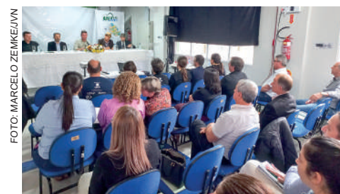
ASSEMBLEIA foi realizada em Ibirama

Em SC, 25% da arrecadação do ICMS retorna aos municípios de acordo com seu índice de participação. Sem os recursos extras de impostos postergados