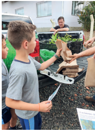
ESTUDANTES participaram de palestra e atividades de plantio de árvores

cada instituição, que também receberam mudas. Cinco destas mudas foram plantadas no pátio de cada uma das escolas pelos alunos e professores.