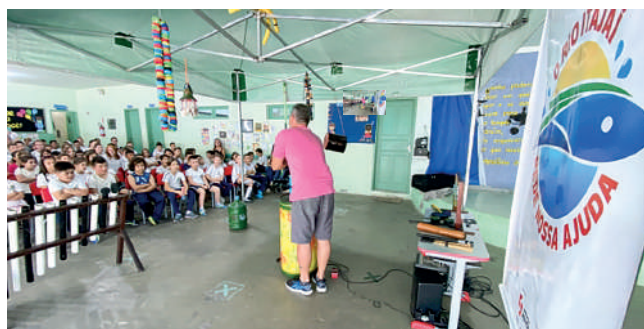
ATIVIDADES foram realizadas em Apiúna, Ibirama e Lontras

Em Apiúna, Ibirama e Lontras, alunos das Escolas