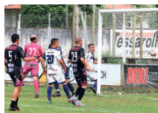
CRUZEIRO venceu por 4x3