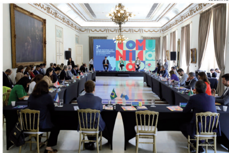
2º Fórum Nacional das Secretarias Estaduais de Comunicação, realizado no Rio de Janeiro

“Uma diretriz que o governador Jorginho Mello sempre nos passou é que devemos fazer Santa Catarina interagir e se mostrar protagonista em questões nacionais. Aproveitamos para trazer a nossa experiência, nossas potencialidades na área de comunicação.