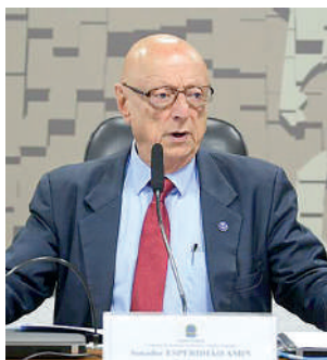
SENADOR defendeu projeto

Em Santa Catarina, a situação é particularmente complexa, pois há centenas de famílias de produtores rurais ameaçadas de perder suas propriedades. Segundo a Secretaria de Estado da Agricultura e Pesca de Santa Catarina, cerca de