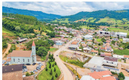
EX-PREFEITO e ex-secretário tiveram condenações mantidas

A denúncia acrescenta que após isso, e sob questionamento, foi realizado novo contrato, dessa vez com licitação, de mão de obra para construção do restante da edificação, mas que partes da primeira parcela da construção tiveram de ser demolidas em face da precariedade dos trabalhos. Os materiais de construção teriam sempre sido