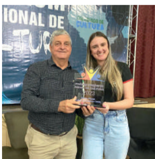
PRÊMIO reconhece política públicas em prol da cultura

A iniciativa é um reconhecimento dos esforços de gestores municipais que implantaram políticas públicas referentes a cultura. O prêmio foi baseado em um diagnóstico realizado nos municípios,