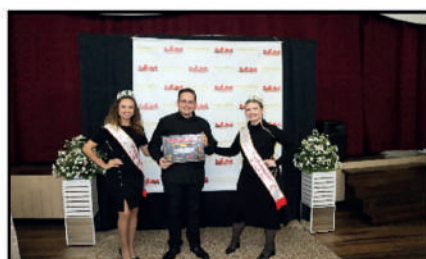
JORNAL VALE DO NORTE - JORNAL IMPRESSO DESTAQUE DO ANO