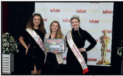
DORA CONTABILIDADE - ESCRITÓRIO DE CONTABILIDADE E CONTADORA DESTAQUE DO ANO