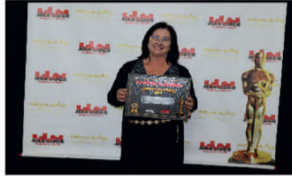
HARMONIZA EVENTOS - ESPAÇO DE EVENTOS DESTAQUE DO ANO