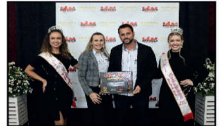
PH ENGENHARIA E CONSTRUÇÃO - CONSTRUTORA DESTAQUE DO ANO