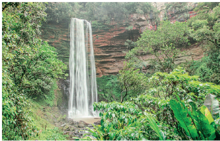
CACHOEIRA Tabarelli, é uma das principais atrações. Ela possui o maior volume d'água entre as cachoeiras localizadas no município

Em Presidente Getúlio uma das principais atrações é a Ca-