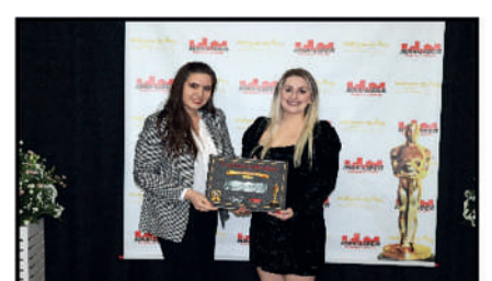
SORRIA MAIS - CLÍNICA ODONTOLÓGICA DESTAQUE DO ANO