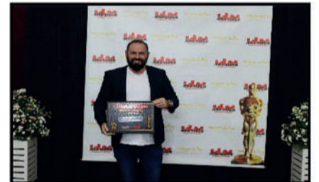
HOTEL SORALETE - GRUPO ROSABLUE - HOTEL DESTAQUE DO ANO