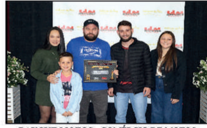
BAUCKE MOTOS - COMÉRCIO DE MOTOS NOVAS E USADAS DESTAQUE DO ANO