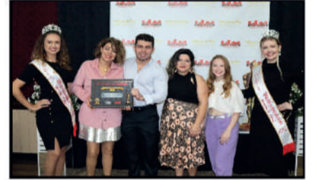
STUDIO DE BELEZA ROSE - INSTITUTO DE BELEZA DESTAQUE DO ANO