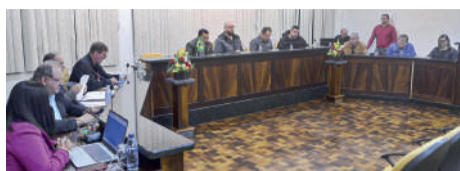
ESCOLA contratou segurança por 30 dias através da APP. Obras devem iniciar em 30 dias

Ela ocupou a tribuna cultural para pedir esclarecimentos sobre as ações do Executivo para melhorar a segurança no educandário, já que os serviços de vigilância foram encerrados no dia 13 de agosto. A decisão foi tomada, na ocasião, em virtude