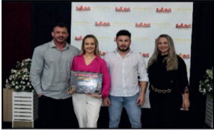
CÍRICO IRON GYM - ACADEMIA DE MUSCULAÇÃO DESTAQUE DO ANO