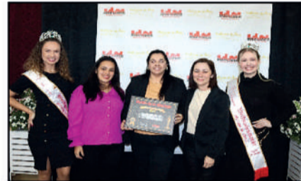
EMPÓRIO DOS GRÃOS - COMÉRCIO DE PRODUTOS NATURAIS DESTAQUE DO ANO