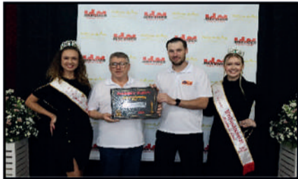
RESTAURANTE ARCA - RESTAURANTE DESTAQUE DO ANO