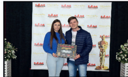
W MAQ - COMÉRCIO E MANUTENÇÃO DE MÁQUINAS DE COSTURA DESTAQUE DO ANO