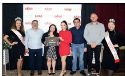
RÁDIO BELOS VALES - RÁDIO MAIS OUVIDA DO ANO