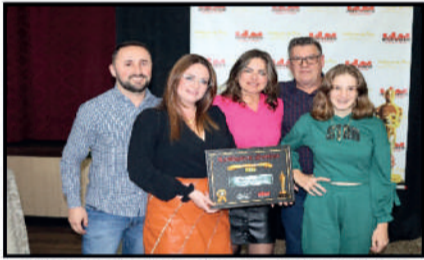
IMOBILIÁRIA TAFAREL - IMOBILIÁRIA DESTAQUE DO ANO