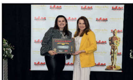
FLORICULTURA BEIJA FLOR - FLORICULTURA DESTAQUE DO ANO