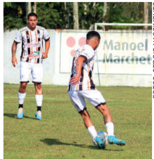
GUARANI empatou em casa