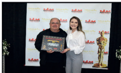
COMERCIAL AMARILDO - COMÉRCIO DE MATERIAIS DE CONSTRUÇÃO DESTAQUE DO ANO