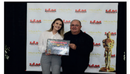
COMERCIAL AMARILDO - COMÉRCIO QUE MAIS SE DESTACA DO ANO