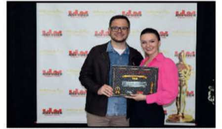
HAUKEMIA - CENTRO MÉDICO VETERINÁRIO - CLÍNICA VETERINÁRIA DESTAQUE DO ANO