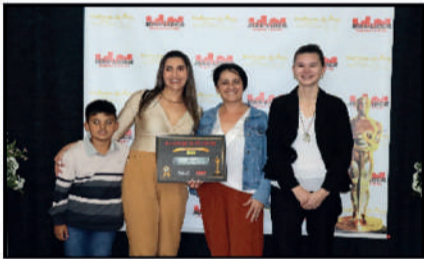
ALECRIM - LAVANDERIA E PASSADORIA DESTAQUE DO ANO