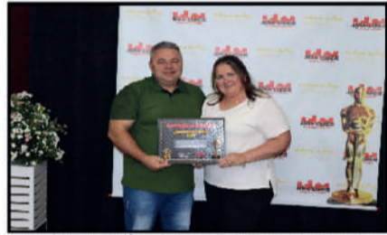
AGROPECUÁRIA JONY, JENY E JEYSOM - AGROPECUÁRIA E COM. DE RAÇÕES E CONCENTRADOS DESTAQUE DO ANO