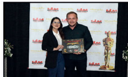
COMERCIAL AMARILDO - COMÉRCIO DE PRODUTOS E EQUIPAMENTOS PARA PISCINAS DESTAQUE DO ANO