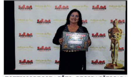
TOTTIOLI DECORAÇÕES - DECORAÇÕES PARA EVENTOS DESTAQUE DO ANO