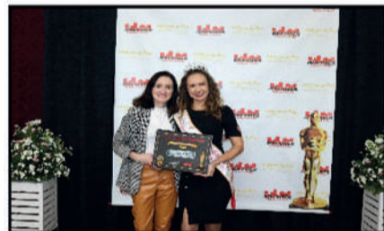
SANTA MODA - LOJA DE MODA MASCULINA DESTAQUE DO ANO