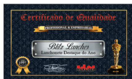
BLITZ LANCHES - LANCHONETE DESTAQUE DO ANO