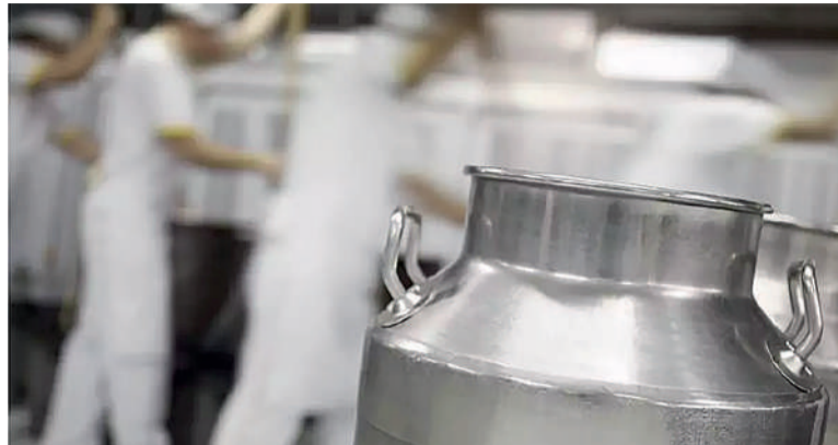
PRESIDENTE GETÚLIO produz uma média de 22 milhões de litros de leite por ano