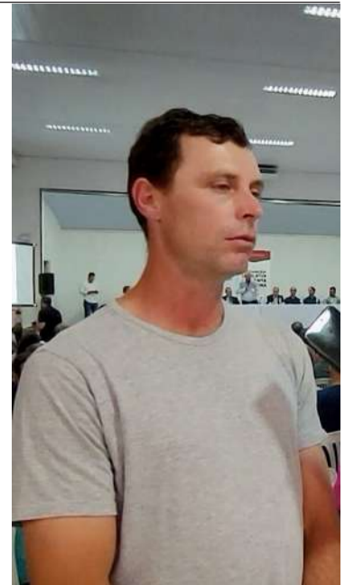
PRODUTORES enfrentam dificuldades

Proponente da audiência em Presidente Getúlio, o deputado Oscar Gutz defendeu o controle da importação de leite, além da disponibiliza-