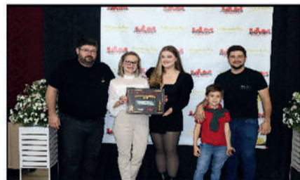
KESKE'S - CONFEITARIA DESTAQUE DO ANO