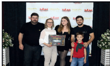
KESKE'S - PANIFICADORA DESTAQUE DO ANO