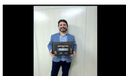
EDIMAR IMÓVEIS - SITE DESTAQUE DO ANO