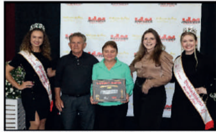
LAURITA CONFECÇÕES - LOJA DE CONFECÇÕES DESTAQUE DO ANO