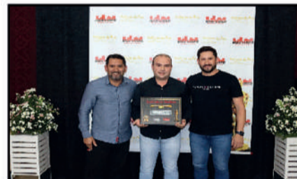
J & C VEÍCULOS - COMÉRCIO DE VEÍCULOS SEMI NOVOS DESTAQUE DO ANO