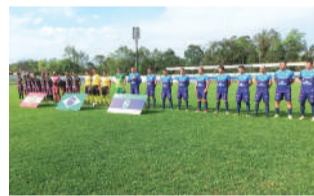
CRUZEIRO venceu em Rio do Sul