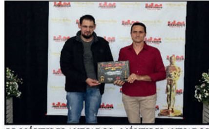
LL MÓVEIS PLANEJADOS - MÓVEIS PLANEJADOS E SOB MEDIDA DESTAQUE DO ANO