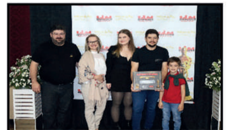
KESKE'S - CAFETERIA DESTAQUE DO ANO