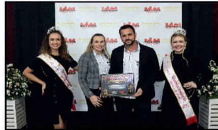
PH ENGENHARIA E CONSTRUÇÃO - ESCRITÓRIO DE ENGENHARIA DESTAQUE DO ANO