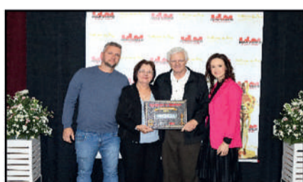
LOJA GUBLER - MATERIAIS ELÉTRICOS E HIDRÁULICOS DESTAQUE DO ANO