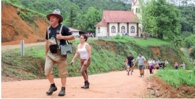
CAMINHADA terá início às 8h30, após café colonial

A recepção dos participantes será às 7h, quando também será servido um café rural aos participantes, no valor de R$ 20. A caminhada tem início às 8h30min, e será realizada em três alternativas de trajeto, uma com 5 quilômetros, a oficial com 11,5 quilômetros e outra, com 15,5 quilômetros. Os percursos contam com belíssimas paisagens rurais, arquitetura enxaimel, trilhas e estradas de roça situadas em propriedades particulares. Os participantes serão acompanhados pelo Bierwagen, o Carro da Cerveja, e também o Musikwagem, o Carro da Música. As inscrições devem ser feitas no site