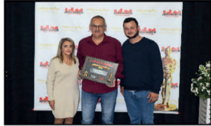
CRISLEY CLIMATIZAÇÕES E SERVIÇOS - REFRIGERAÇÃO E CLIMATIZAÇÃO DESTAQUE DO ANO