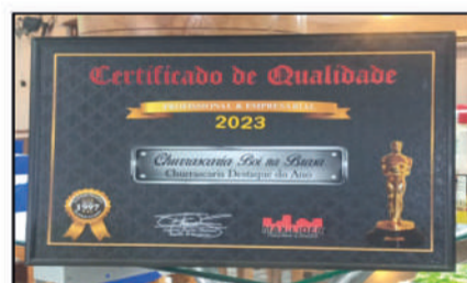
CHURRASCARIA BOI NA BRASA - CHURRASCARIA DESTAQUE DO ANO