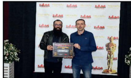
COMERCIAL AMARILDO - LOJA DE TINTAS DESTAQUE DO ANO