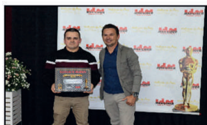
COMERCIAL AMARILDO - LOJA DE PISOS E AZULEJOS DESTAQUE DO ANO