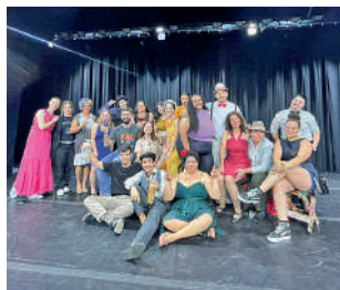
GRUPO de Ibirama foi destaque