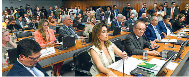
DE acordo com o texto, será preciso comprovar que vinha sendo habitada na data da promulgação da Constituição Federal em 1988

A proposta, que ficou mais conhecida como PL 490/2007, foi aprovada pela Câmara dos Deputados no final de maio, após tramitar por mais de 15