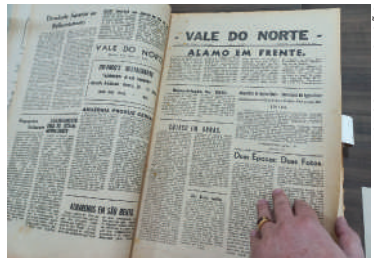
IMPRESSO começou a circular em 1961