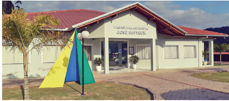
DECRETO provocou polêmica e foi justificado como mal-entendido

De acordo com o Censo do IBGE, José Boiteux é o quarto entre os 295 municípios do Estado com maior população