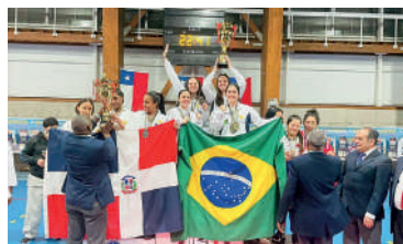
EQUIPE garantiu 10 medalhas

O técnico responsável pela equipe é o professor Faixa pre-