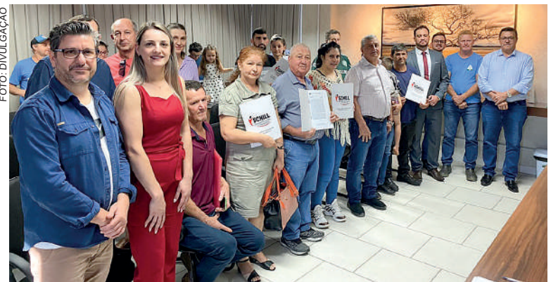
PROGRAMA de regularização foi constituído em 2018

FORAM BENEFICIADOS mais de 20 moradores dos loteamentos José Luiz Poffo e Schill Empreendimentos