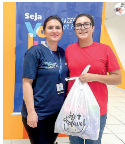
DOAÇÕES foram entregues nos meses de julho e agosto

No Alto Vale, ela foi realizada em parceria com a Fiesc, através da Gerência de Responsabilidade Social, Sesi/Senai, vice-presidência e sindicatos patronais.