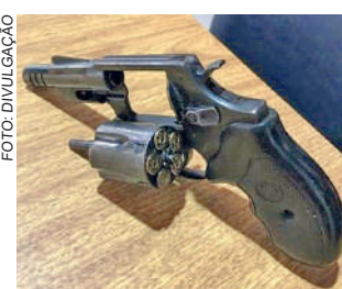
REVÓLVER calibre 38 foi apreendido

Conforme informações divulgadas pela po-