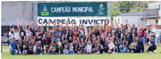
A SER GUARANI sagrou-se campeã invicta do campeonato

Mantendo o Fair Play esportivo, a diretoria do Guarani parabenizou o Taquaras por mais uma final emocionante em Ibirama e pela sua segunda final consecutiva. "Em especial à equipe da ADC