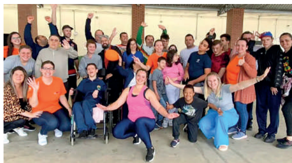
DIVERSAS atividades são realizadas para marcar data importante