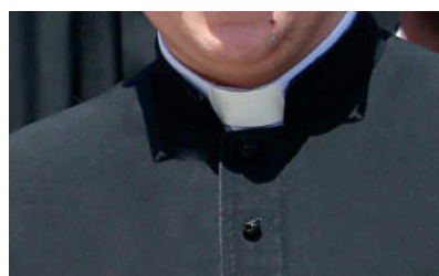
CABE recurso da condenação

Um padre condenado à prisão em 2017 por abusar sexualmente de um jovem, à época adolescente, em Ibirama também terá que indenizar a vítima em R$ 50 mil por danos morais. A decisão foi um juiz da Comarca do Alto Vale. O caso ocorreu entre 2005 e 2009. Cabe recurso