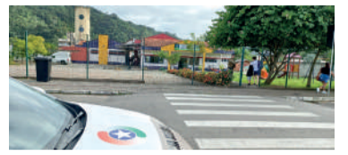
NOTA enviada ao JVN diz que escolas são atendidas

Em nota, a Secretaria de Segurança Pública informou que no município de Ibirama a Polícia Militar de Santa Catarina (PMSC) disponibiliza policial da reserva fazendo a segurança diariamente do ambiente escolar. Não identificamos os locais