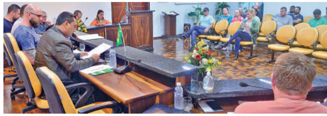
ENTRE os temas levantados estava a perda de mandato de Poffo

Conforme o vereador, alguns vereadores estão fazendo julgamento e condenando o prefeito sem provas. “Estamos aqui para fazer valer a lei e não se beneficiar da desgraça dos outros. É o que vamos fazer. Se o prefeito Adriano for culpado, vamos fazer valer a lei.