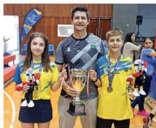
ATLETAS representaram o Brasil nos Panamericanos

No Campeonato Sulamericano, apesar de terem apenas 12 anos, ambos fizeram parte da seleção brasileira Sub15 e sagraram-se vice-campeões, sendo