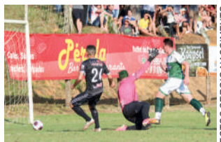
GUARANI saiu na frente