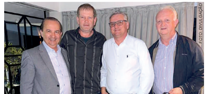
ENCONTRO ocorreu em Indaial