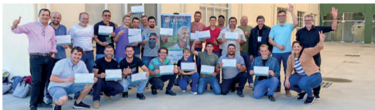
EMPRETEC Rural é aberto para profissionais da área da produção vegetal

O Empretec Rural é aberto a empreendedores, técnicos e profissionais envolvidos nas cadeias produtivas de origem vegetal (hortifruticultores, produtores de grãos, empreendedores de reflorestamento, por exemplo) e animal (criadores de gado, suínos, aves), além dos ligados à aquicultura. Com metodologia da Organização das Nações Unidas, busca lapidar postura do profissional e potencializar resultados