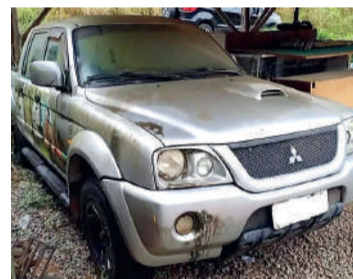
SÃO sete lotes, que podem ser conferidos nos dias 30 e 31 de agosto

O edital e regulamento do Leilão Público pode ser encontrado no site da empresa Eckert Tecnologia e Assessoria LTDA, o www.eckertleiloes.com.br .