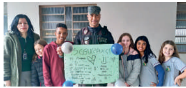
ALUNOS se despediram de segurança

Ainda conforme informado, o município vem investindo significativamente em melhorias estruturais de segurança nas escolas, com a ampliação de muros, cercas, implantação de concertinas, portões eletrônicos com acesso con-