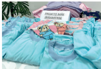
ROUPAS de bebê foram entregues ao projeto Mãe Ibiramense