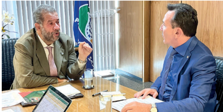
ESPERA por perícias chegava a ser de vários meses em Santa Catarina