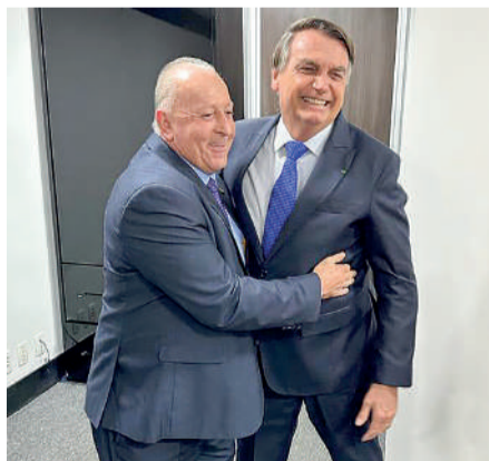
CONVITE foi feito em Ituporanga

De acordo com Gutz a homenagem é justa já que quase 70% da população catarinense reconheceu