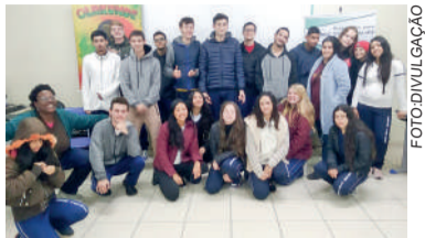
ALUNOS da EEB Gertrud Aichinger foram atendidos pelo projeto

As atividades do projeto Preparação ao Mundo do Trabalho, da OLAKUNDE- Associação Educacional de Formação Intercultural Cidadã contemplaram turmas Ensino Médio preparando-os para atuar no mundo do trabalho